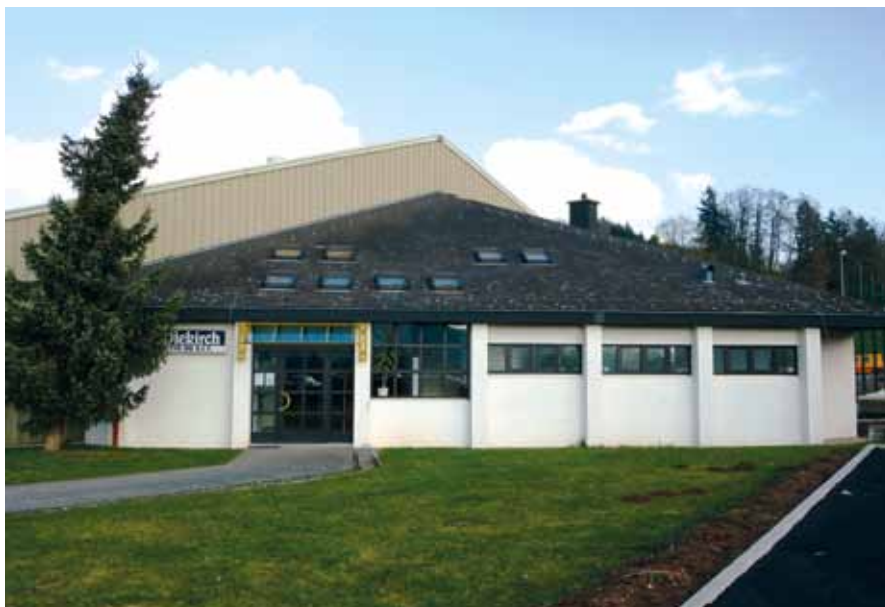
HALL DE TENNIS DU S. I. T. . Erpeldange, am Gruefwee

terrains disponibles: 4 terrains - douches et vestiaires