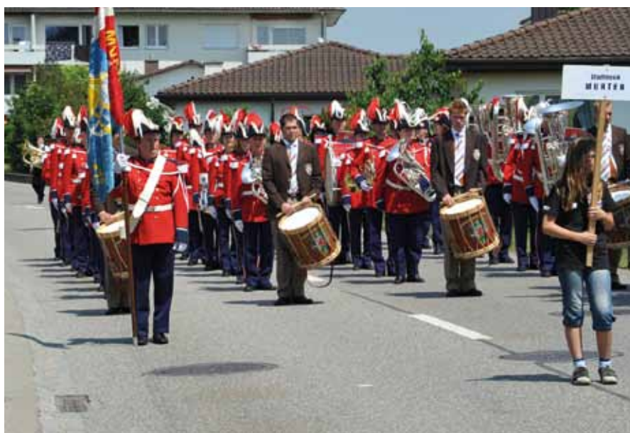
Die Stadtmusik aus Murten