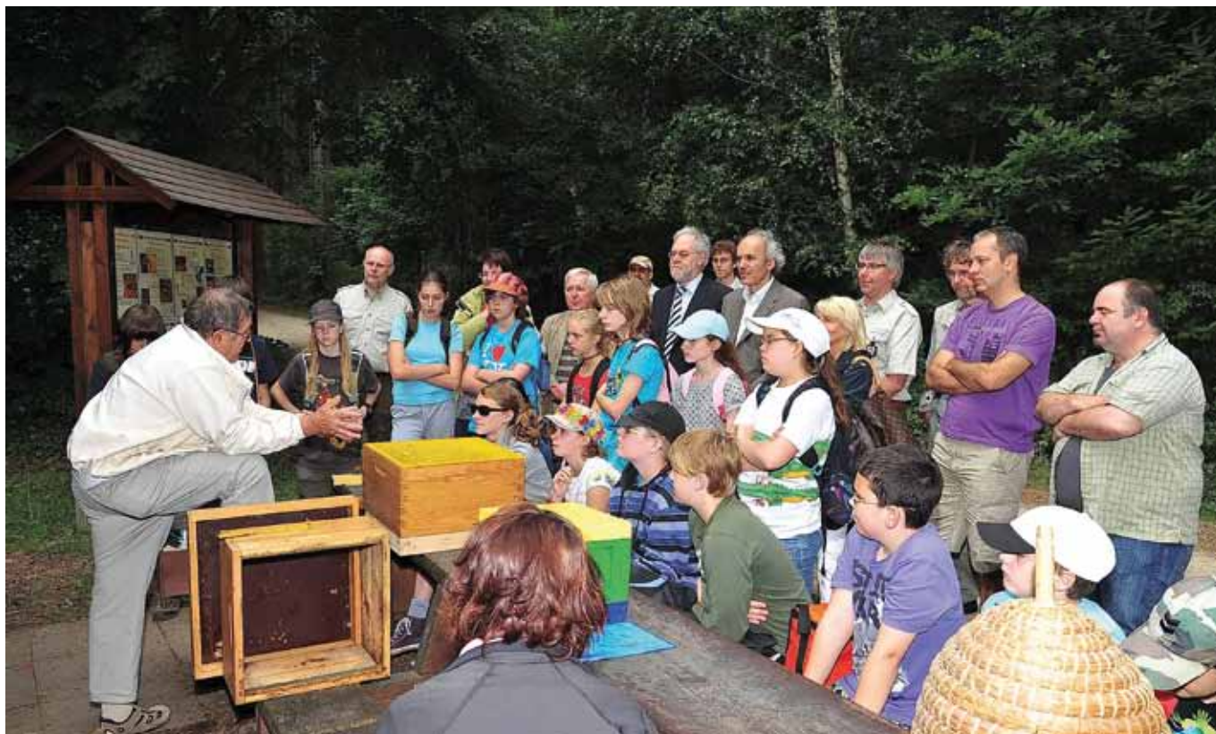
Rund 275 Schüler erlebten mit Minister Marco Schank umweltpädagogische Waldspaziergänge