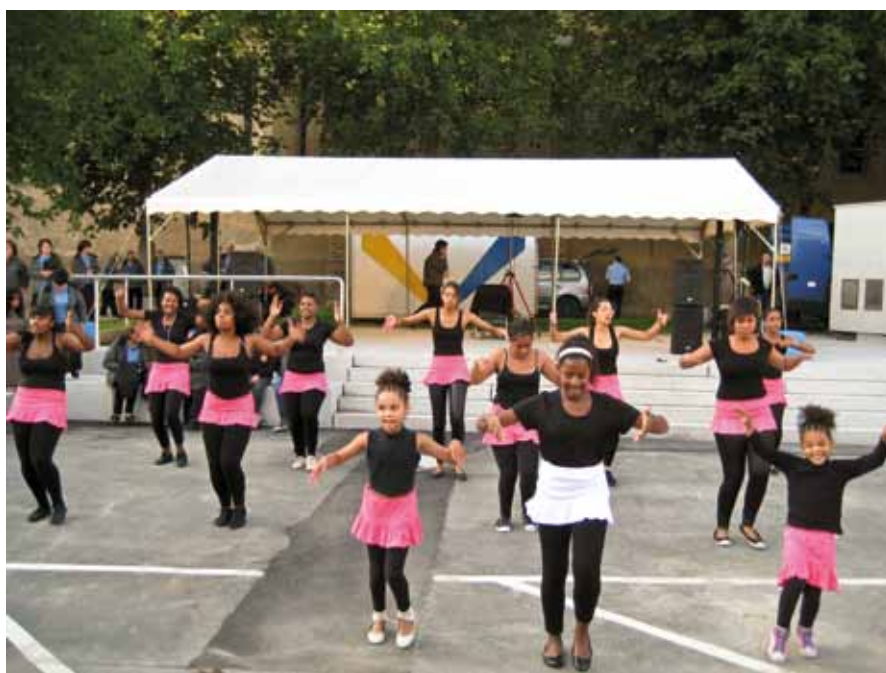
Animation musicale par le Grupo de Cantares de Regiao de Basto et le Groupe de Danse l'Etoile du Cap Vert