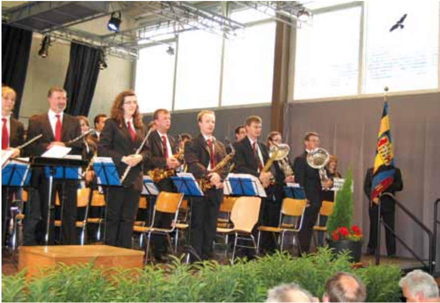
Zum Schluss der offiziellen Darbietung