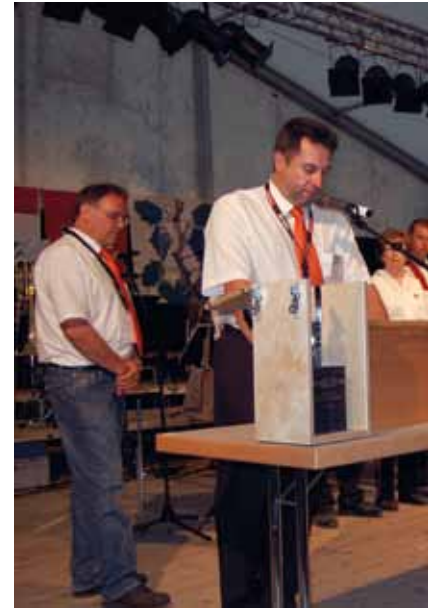
In Erwartung der Resultate

30 Blasmusikgesellschaften, darunter zwei Brassbands, nahmen in diesem Jahr an den Seeländischen Musiktagen im Schweizer Meisberg teil.