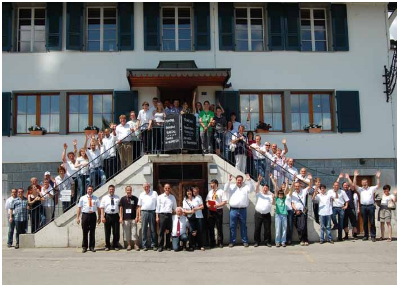
Gruppenbild vor der Heimreise mit den Begleitern und den Gastgebern.