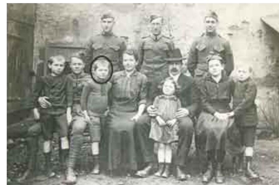
D'Amerikaner woren 1918 kuerz hei aquartéiert. Di Foto hei ass gläich nom Waffenstillstand geholl ginn. Et erkennt een d'amerikanesch Zaldoten un de Wéckelgamaschen! Op der Foto ass mäi Papp, meng Mamm, meng eler Schwëster, meng jénger Schwëster an ech selwer.