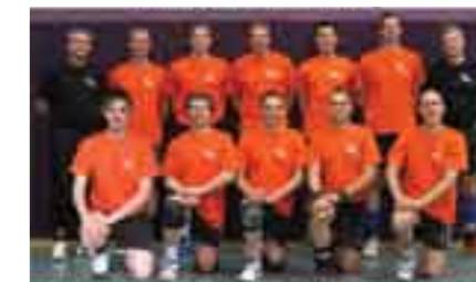
Men Open Team Luxembourg