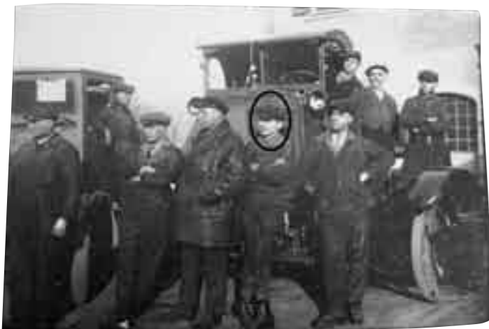
Beim „Traurege Pittchen“