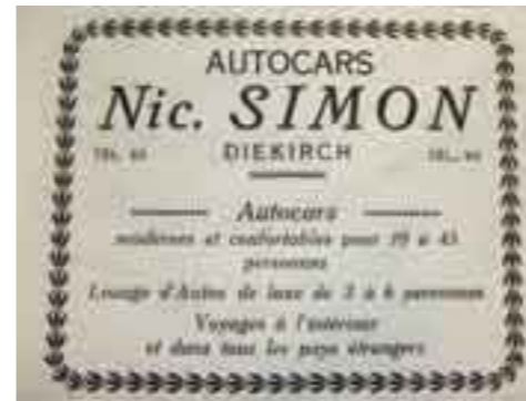
D'Telefonnummer vun der Firma war 93, déi vun der Mercedesgarage 94! Klasens Misch, säi Papp hat e Coiffeurssalon an der Palaststrooss, huet déi Foto vun 1935/36 aus der Mercedesgarage fonnt.