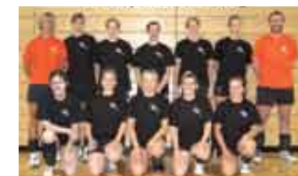
Women Open Team Luxembourg