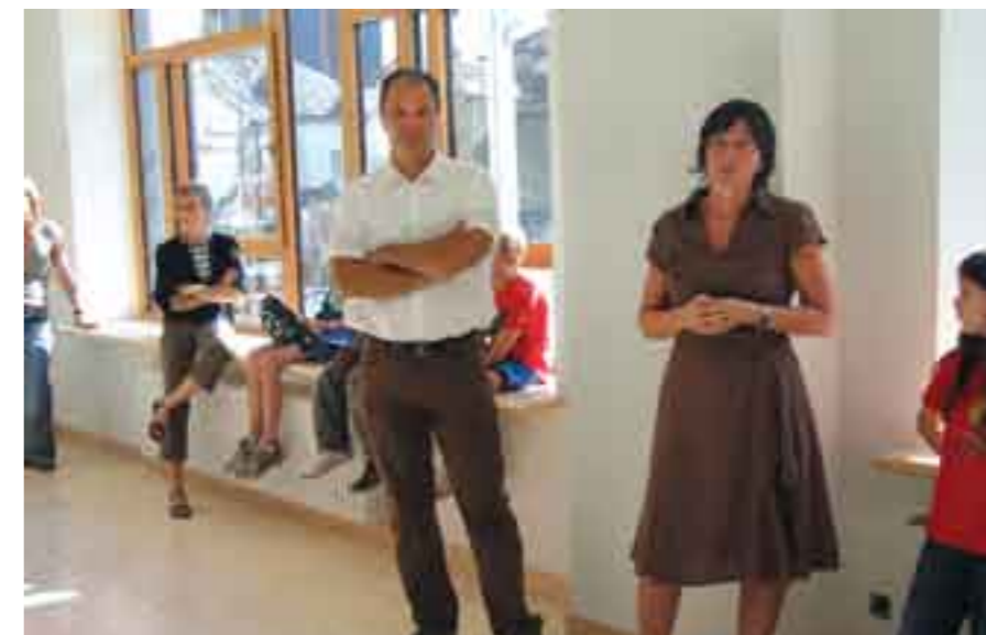
Die Kinder fühlen sich sichtlich wohl in den großen hellen Räumen.