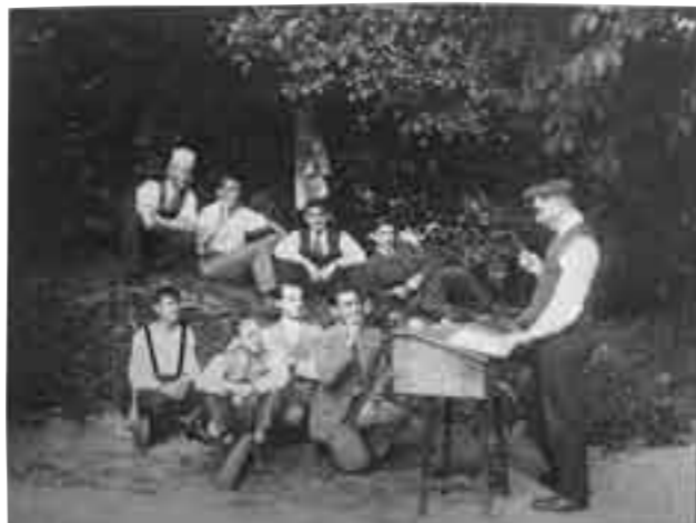
Um Ausflug mam Technikum

T'ass vill changéiert. Wann Der e Bild giff gesinn hei vun der Gare, wéi mäi Papp mat den éischte Busse gefuer ass, da giff Der lech net erëmkennen. Ech hunn hei och nach eng Foto vu 46/47, wou de Kran amgang ass, d'Kluuster ofzerappen, an ech sti mat deenen 2 Elsten do dem Spaass nokucken, an op deem aneren Eck vun der Post, do sti nach Lett ze kucken. Do war de Prisong wou lo d'Post ass!