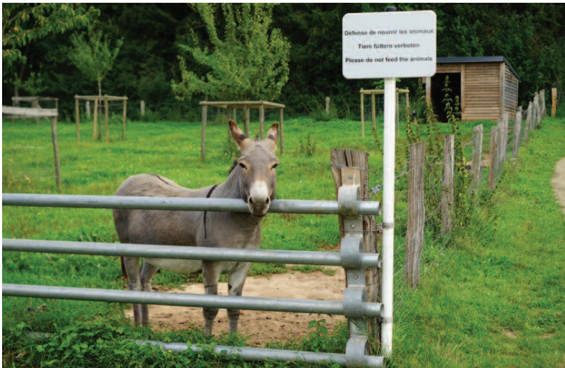
D'Eeselen sollen NET gefiddert ginn!