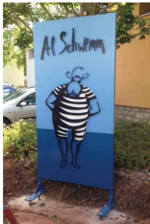
Entrée au Bistrot «Al Schwemm»