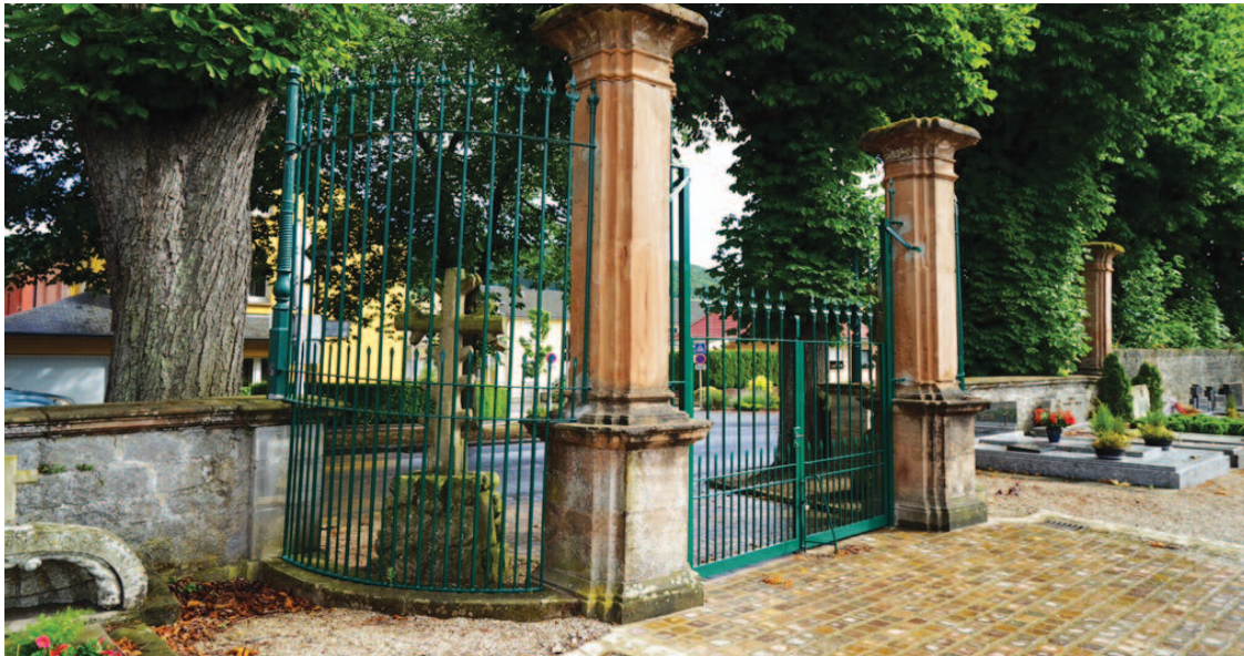
Restauratioun vun der Clôture am Agank vum Kiirfischt