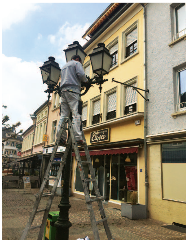
Rénovatioun vun de Stroosselanteren