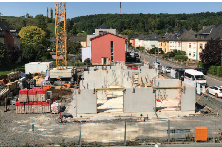
Soziale Wunningsbau rue Vannérus (Fonds du Logement)