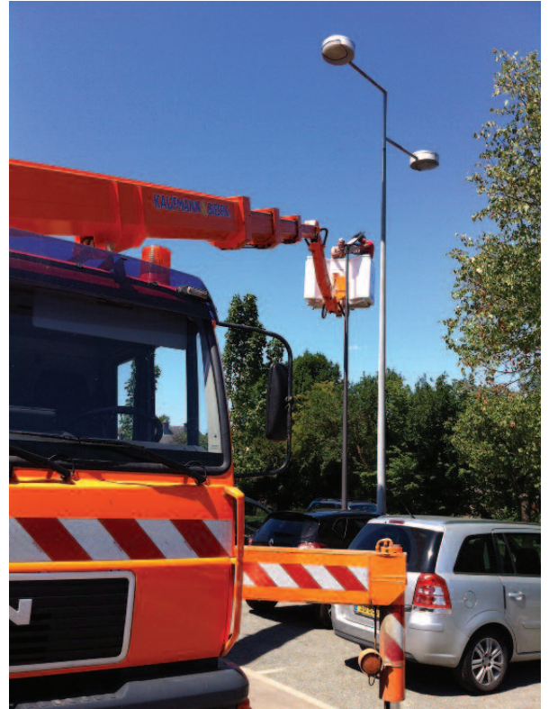
Nei LED Belichtung