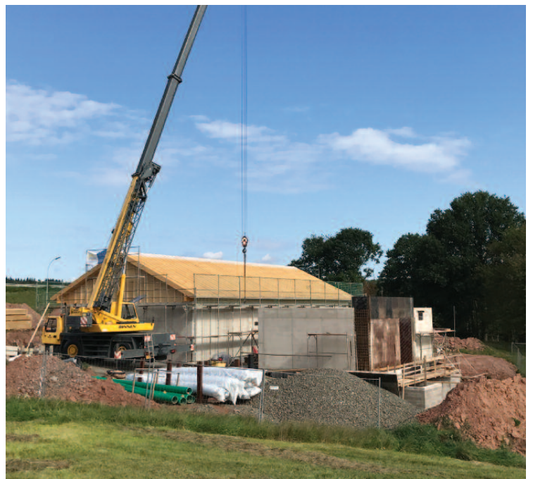
Construction au Fridhaff du nouveau réservoir d'eau potable alimentant la Ville de Diekirch et la Zone d'activités économiques Nordstad (ZANO)