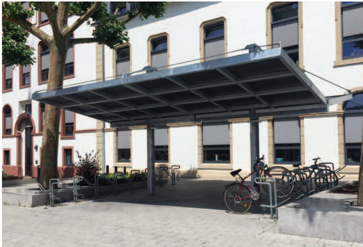
Neien Iwwerdach fir d'Veloën bei der Grondschull