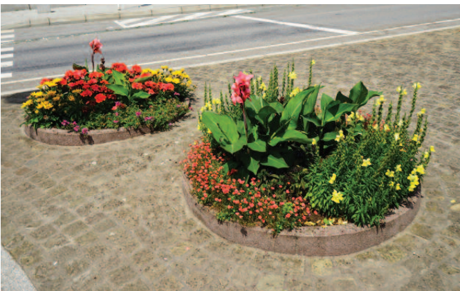
Virun der Dekanatskiirch