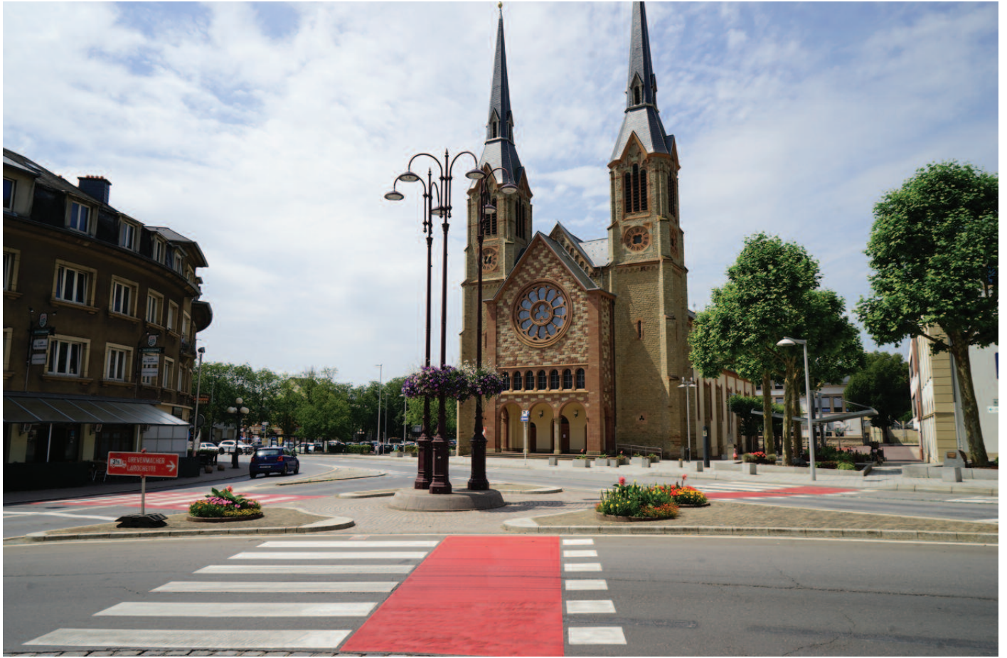
Mesure fir d'Sécherheet vun de Foussgänger