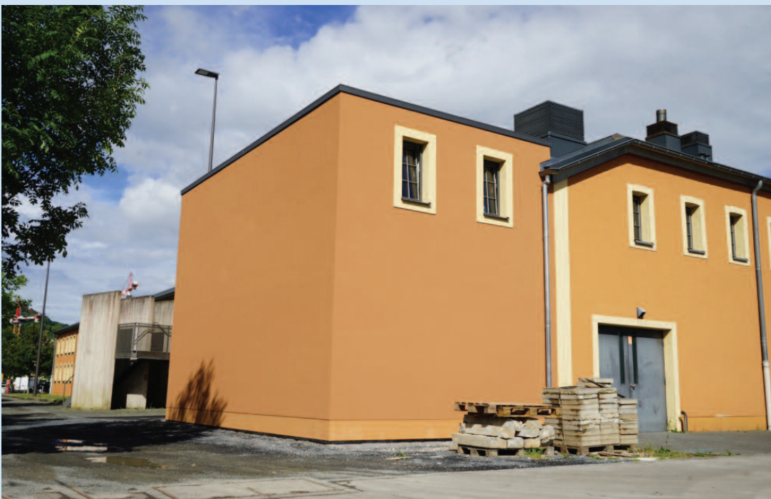
Neien Ubau un d'Al Seeërei