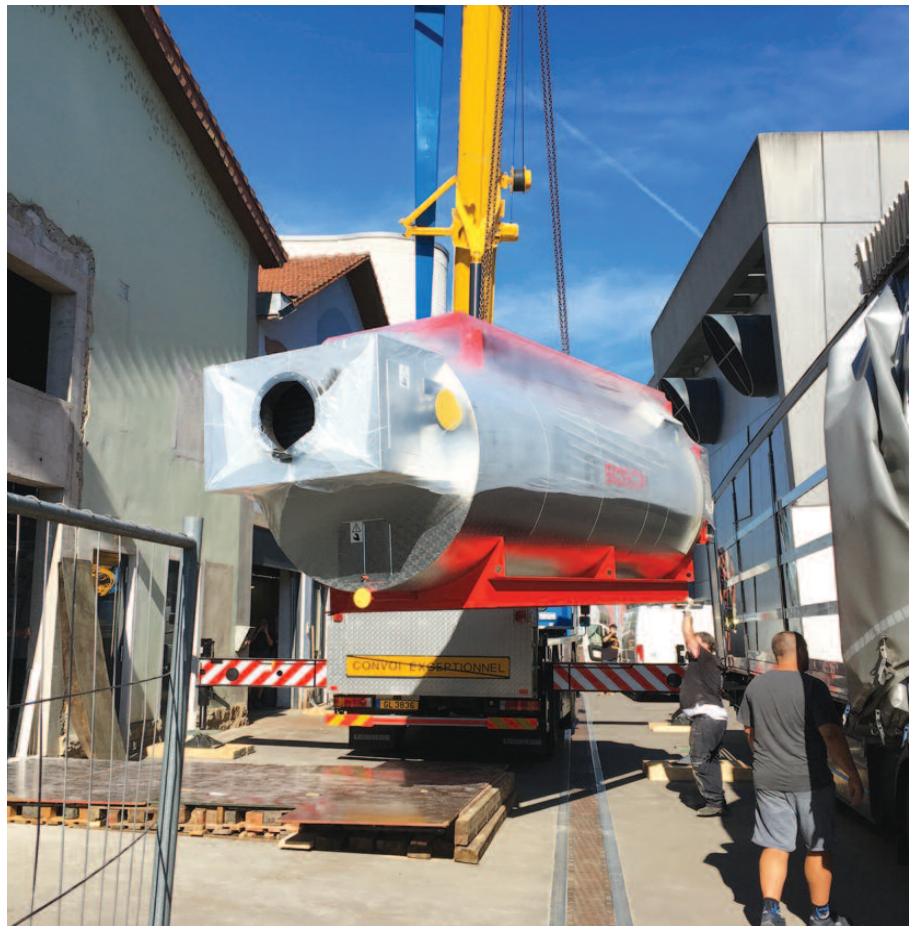
Installation de la nouvelle chaudière avec un brûleur mixte (gaz/fuel) d'une puissance thermique de 4500 kW

Remplacement d'une chaudière de 2500 kW par une nouvelle chaudière avec brûleur mixte gaz/fuel d'une puissance thermique de 4500 kW pour satisfaire à une demande croissante en énergie thermique des clients alimentés par le réseau du chauffage urbain de la Ville de Diekirch.