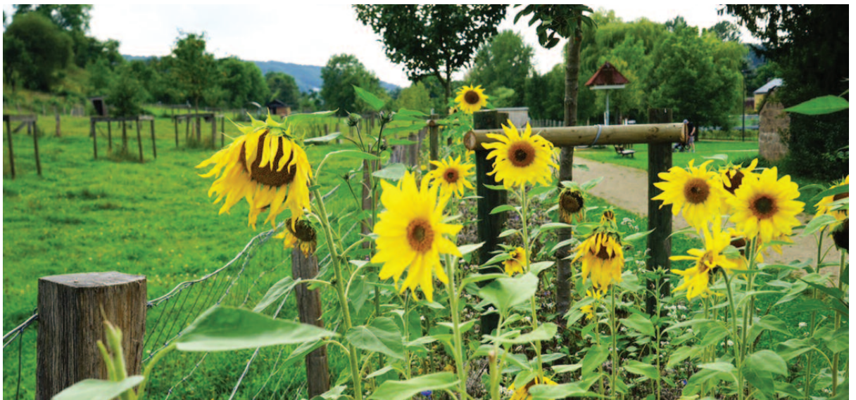
Fir eis Beien (Biodiversitéit)