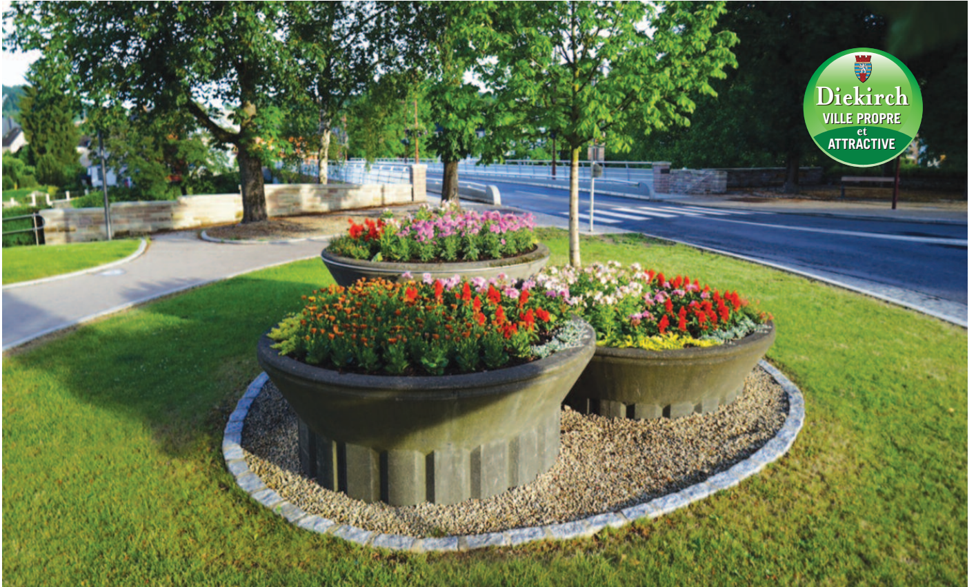
Bei an op der Stenge Bréck