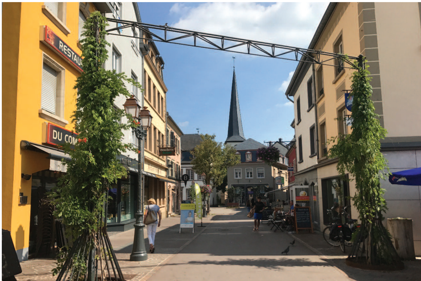
Nei beplanzte Portailën