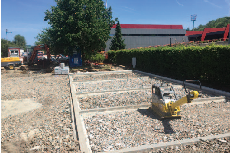
Parking écologique beim Fussballsterrain