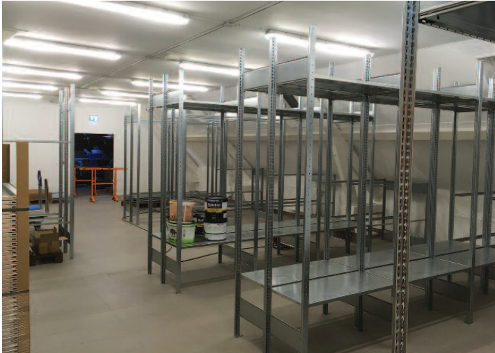
Neie Magasin am Service Technique