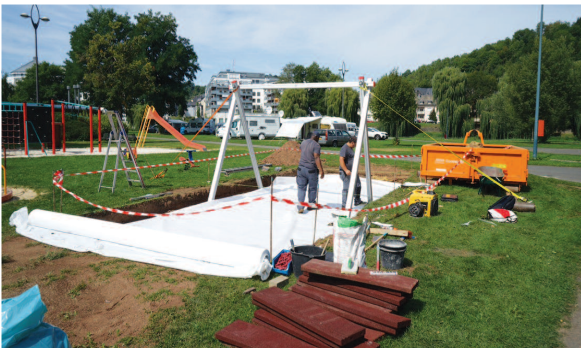
Ausbau vun der Spillplaz um Camping Municipal