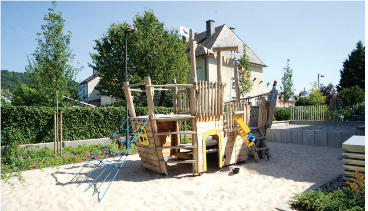
Sozialwunnischen an der Résidence RUCIO (SNHBM) - rue Muller-Fromes Nei öffentlich Spillplaz hannert der Résidence