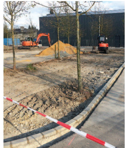
Opbau vun de Parkingsplazen - ökologische Parking