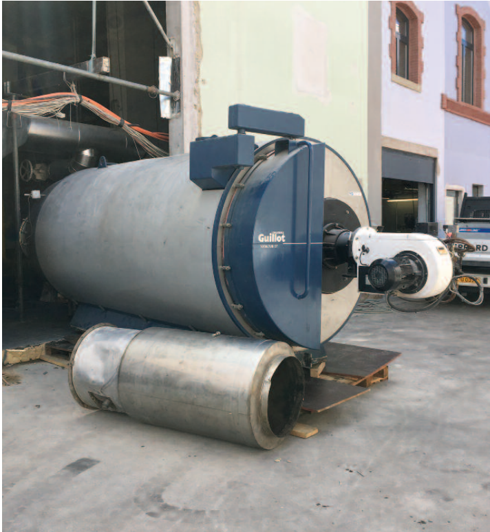
Démontage de la chaudière et de l'ancienne cheminée installée en 1994