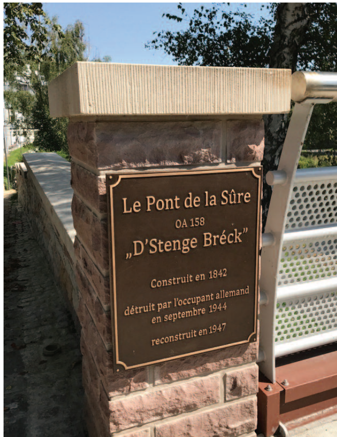
Nei Plaquette un der Bréck