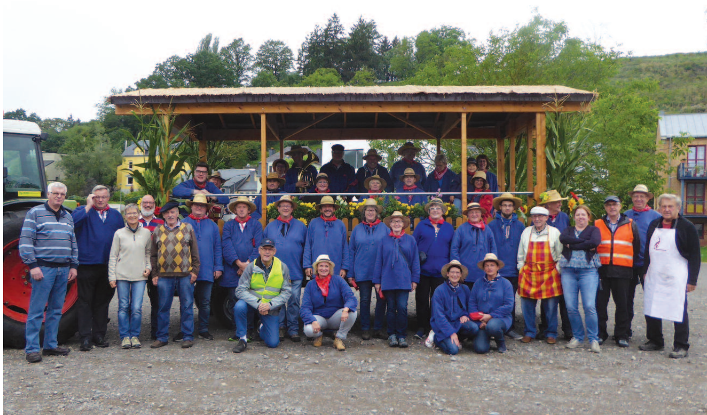
Fir d'Lorenzkiirmes guf an a ronderëm Dikrich den Hämmelsmarsch vun der Chorale St Cécile an der Chorale Sängerbond gesungen