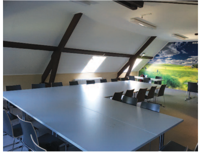
Neie Versammlungsraum fir d'Personal vum Service Technique