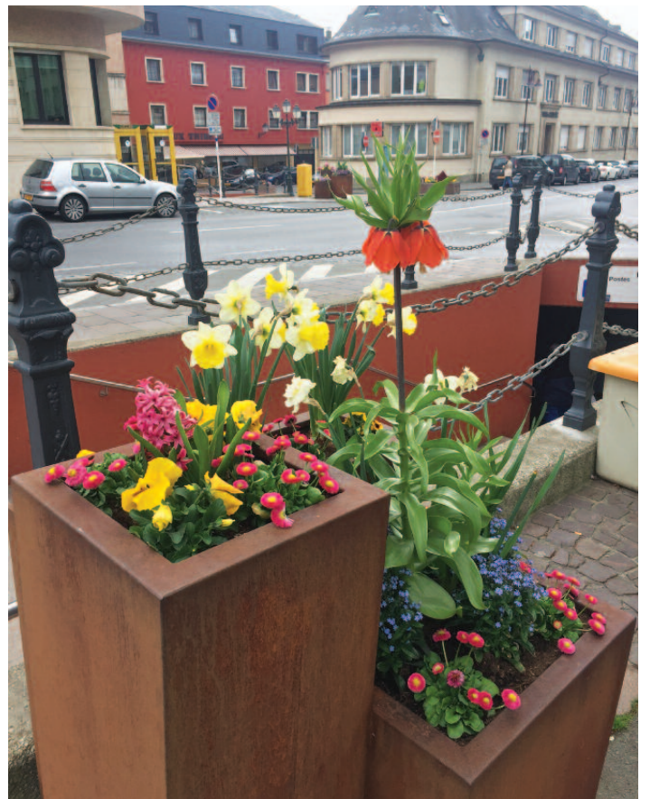
Op der Kluuster