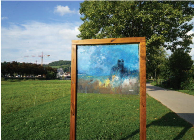
Opstellung vu Konstwierker vum Künstler Roger Wohlfart (Promenade de la Sûre Richtung Holze Bréck)