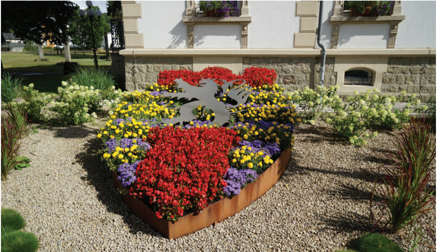
Blummebeeter virun dem Stadhaus