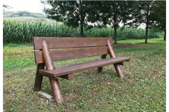
Restauratioun vu sämtliche Bänken op de Feld- a Bëschweeër