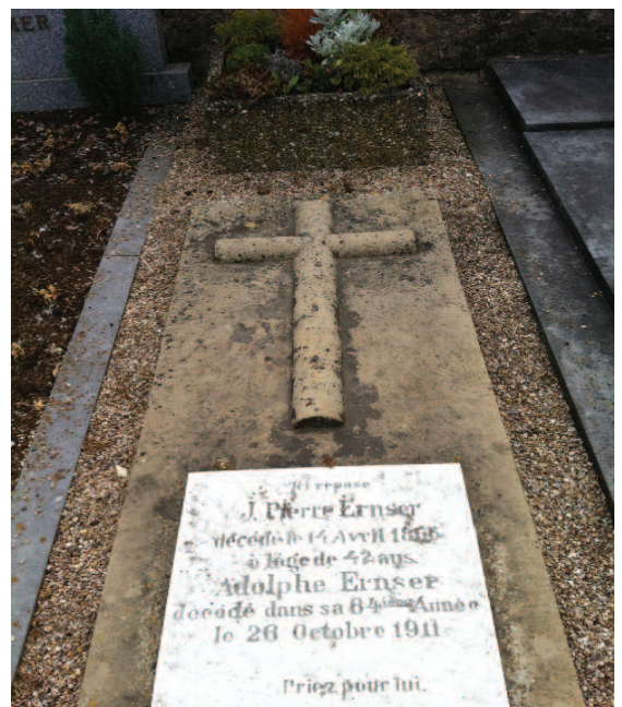
Astandsetzung vun de Griewer BERINGER an ERNSER (Bienfaiteurs de la Ville / Rosière)