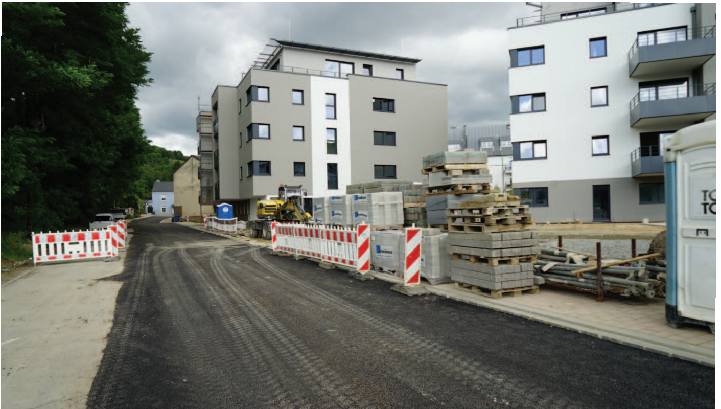
Infrastrukturaarbichten an der «Promenade de la Sûre» beim Lotissement «Wuermkrautwiss»