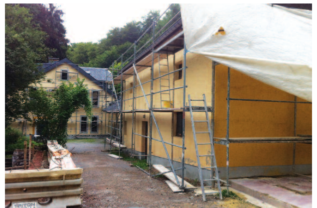
Nei Façaden an Arbichten ronderëm de Foyer Bamerdall