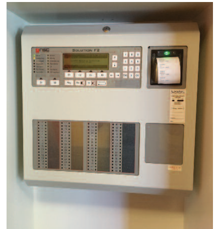
Installatioun vun neie Brandmeldezentralen am Parkhaus Esplanade an am Autsmusée (CNVH)