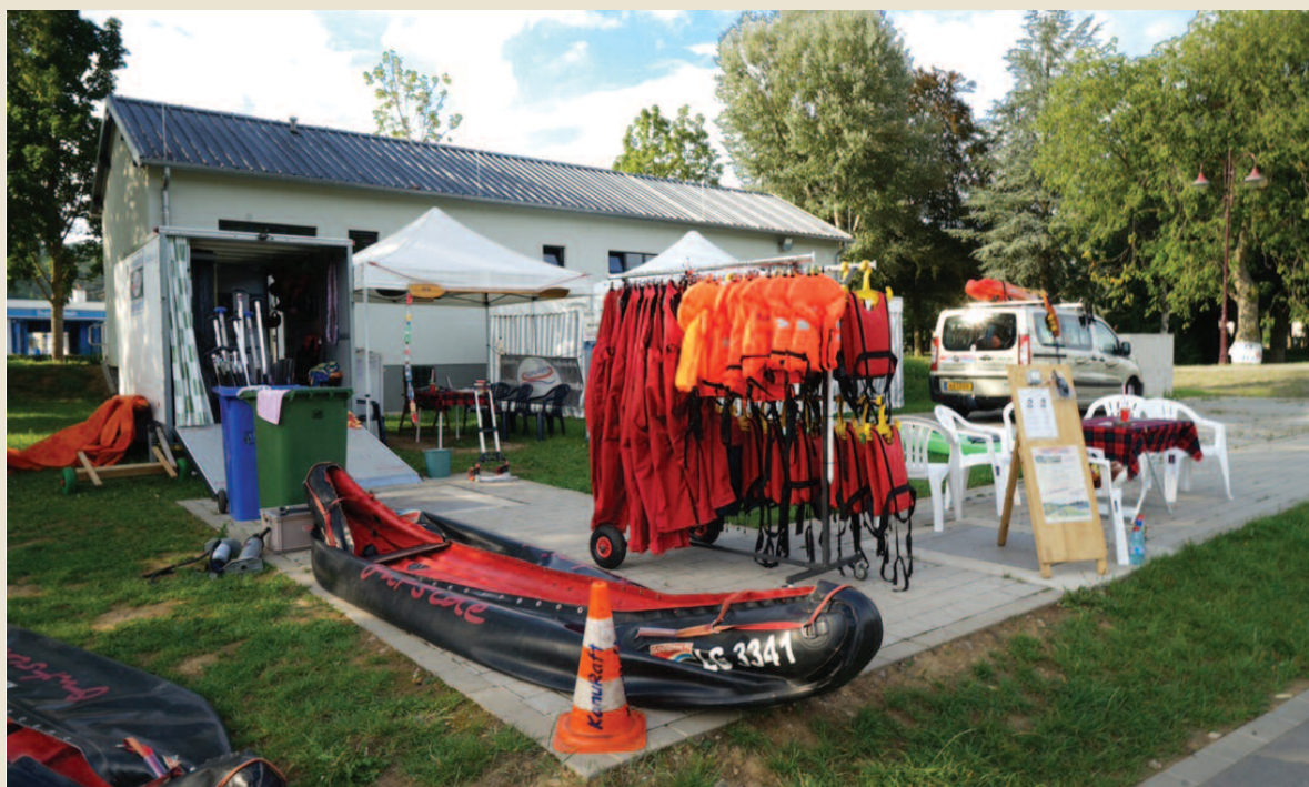
Location de canoë / KanuRaft