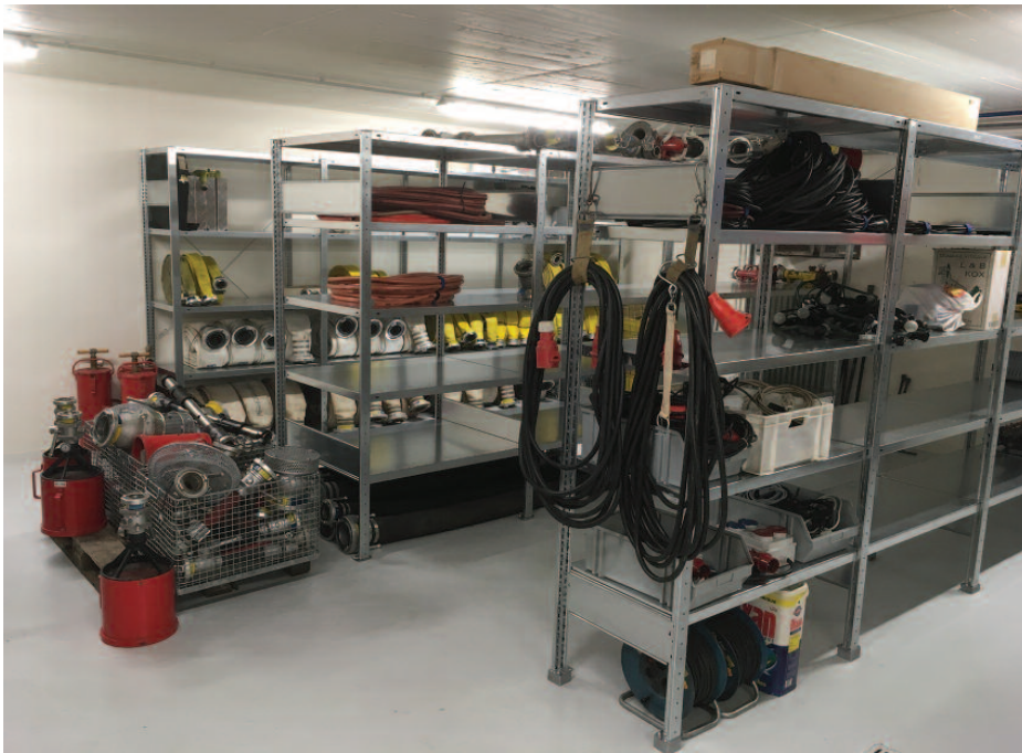
Neit Ersatzdeellager am Pompjesbau