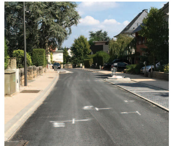
Infrastrukturaarbichten am «Floss»