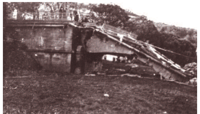
10. September 1944: d'Bréck guf gesprengt