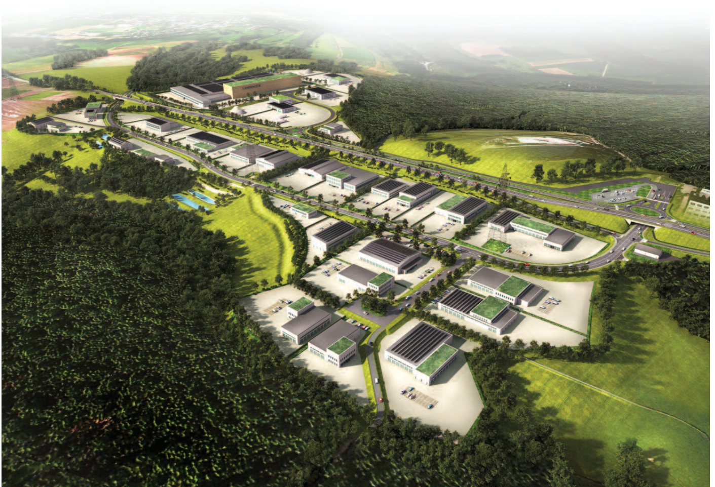
Pose de la première pierre de la zone d'activités économiques Fridhaff le 2 octobre 2017

Plan d'aménagement général de la zone d'activités économiques sur les territoires des Communes de Diekirch et d'Erpeldange-sur-Sûre