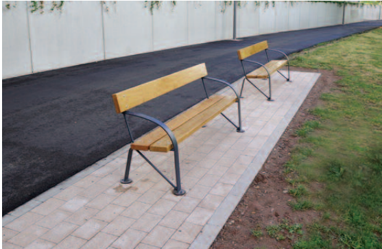
Erneuerung vun der Parkpromenade vun der «Holze Bréck» un bis bei d'«Stole Bréck»