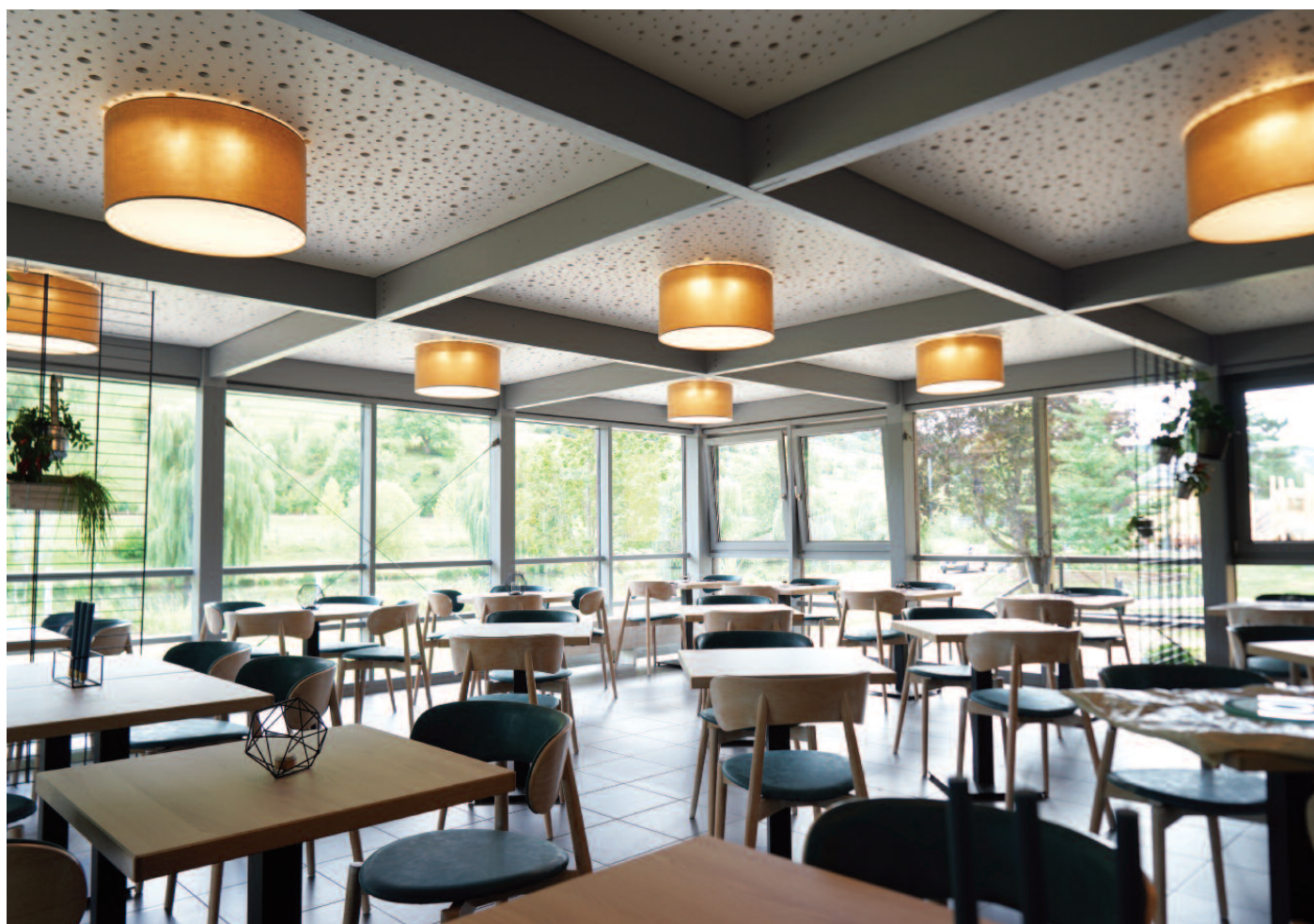
Installation intérieure de l'établissement «Al Schwemm»