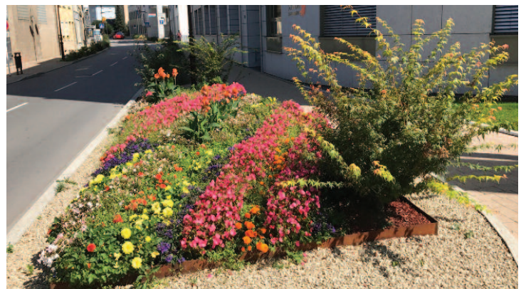
An der Rue Alexis Heck