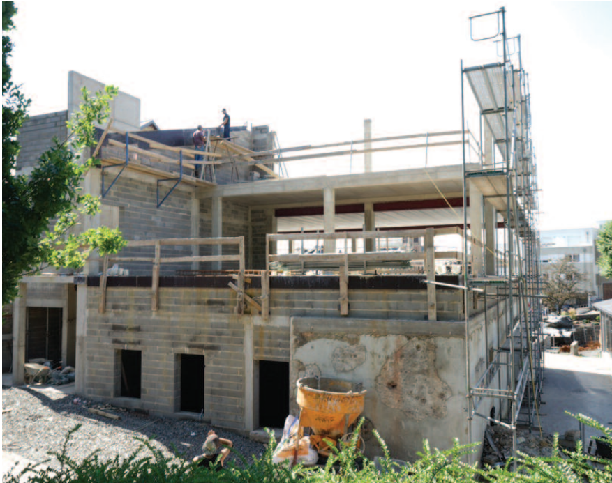
Ausbau vum Musée National d'Histoire Militaire (MNHM)