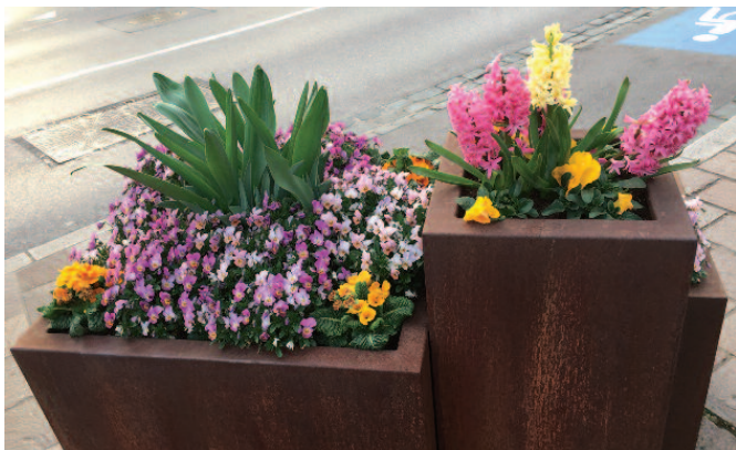
Op der Esplanade