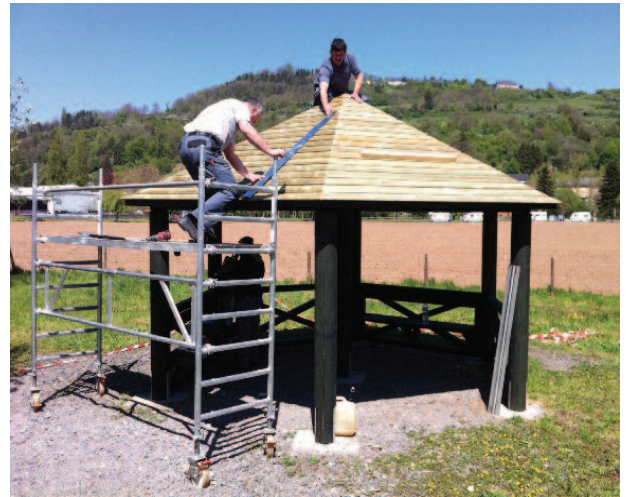
Erneierung vum Chalet am Parc Public «Loumillen»