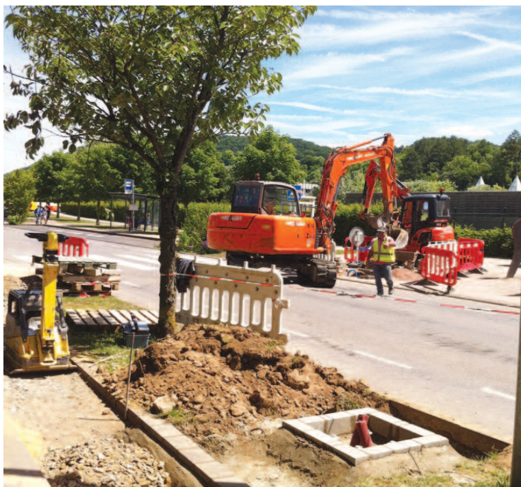
Erneuerung vun de Weeër fir d'Foussgänger an d'Vëlosfuerer an der Rue Merten