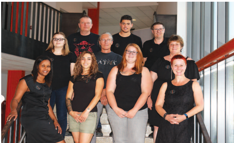
D'Equip vum Scala