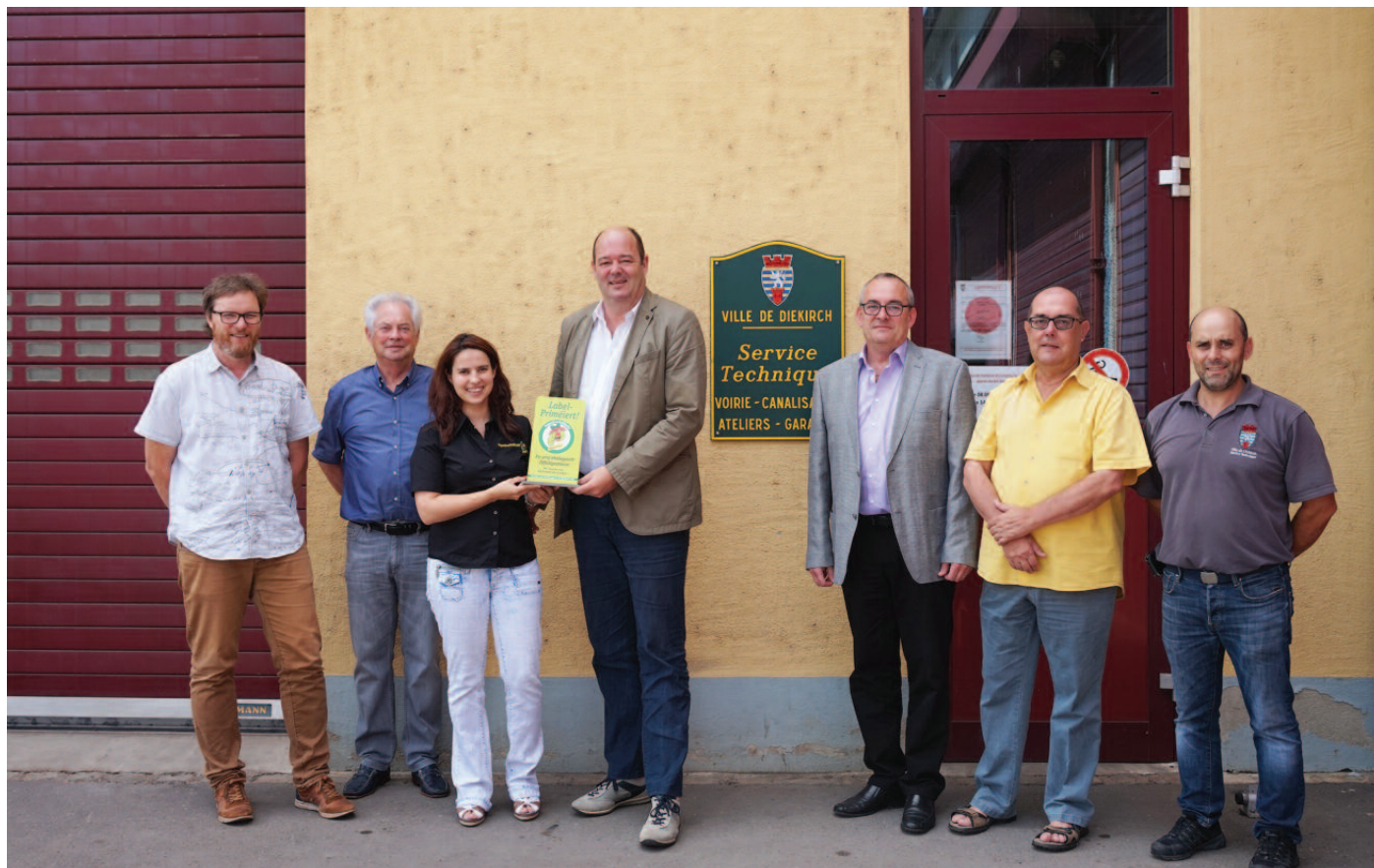
Überreichung des Labels am 20. Juli 2017 an die Diekircher Gemeindeverantwortlichen