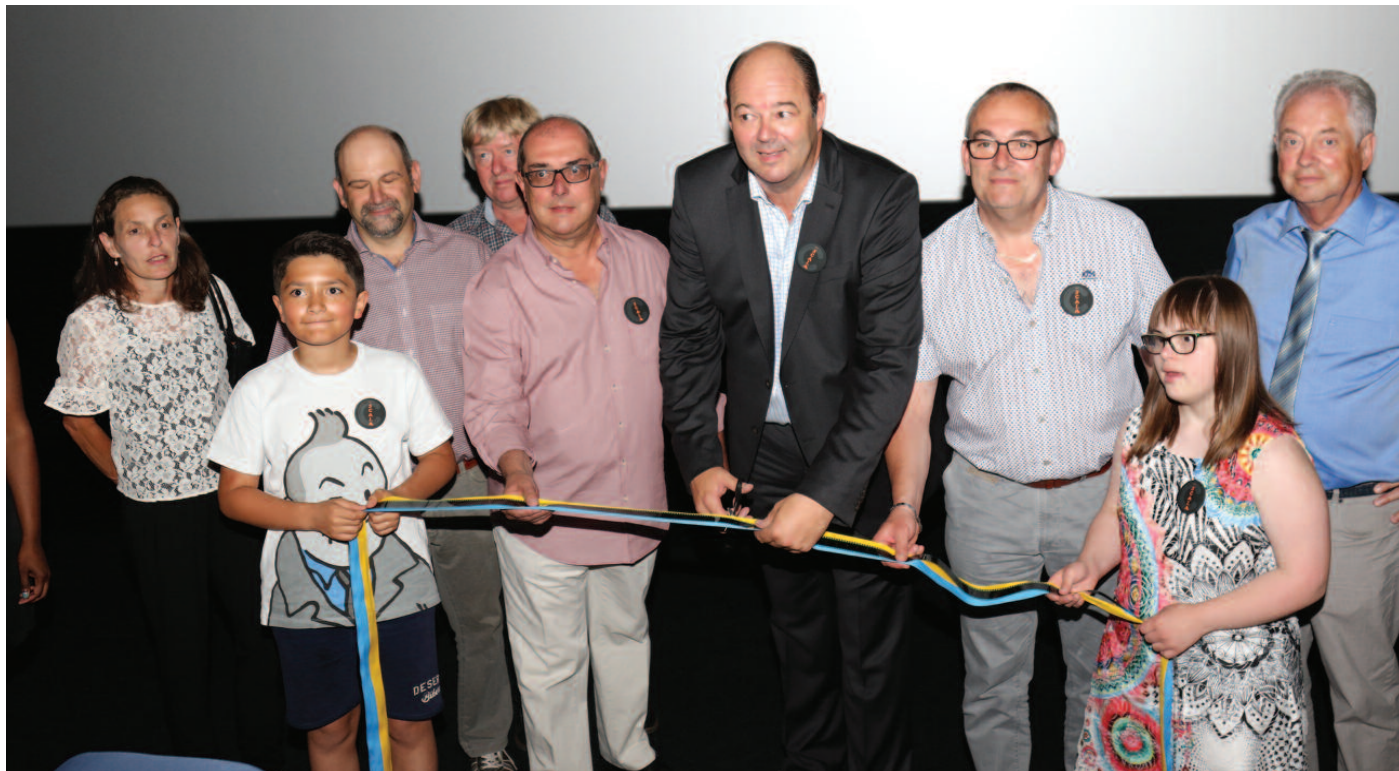
Den neie Kinokomplex besteet aus 5 Säll mat am Ganzen 473 Sätzplazen. An den ischten 8 Wochen no der Ouverture waren 15.972 Visiteuren an de verschiddene Virféierungen. Propriétaire/Exploitant vum Kino SCALA: Dikricher Gemeng