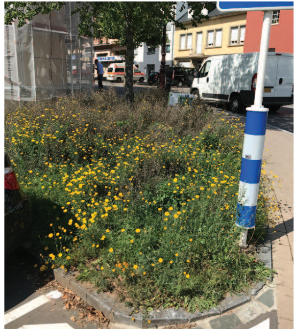
Pestizidfreie Wildblumenfläche Ecke Esplanade / rue Alexis Heck

Auf Wunsch der Administration de la Nature et des Forêts soll der Weg unter den Kastanienbäumen auf der «Kluuster» so aussehen.