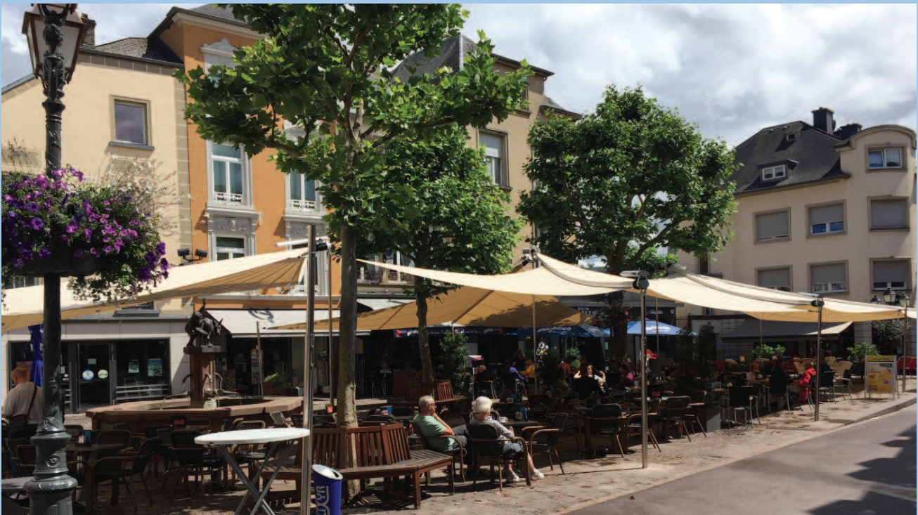
Nei Sonnesegelen op der Liberatiounsplaz