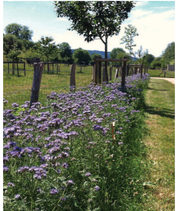
Wëll Blumen am NaturErlebnisPark