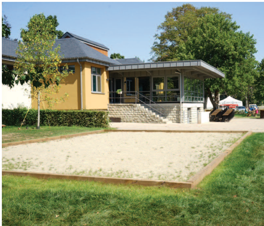
Piste de pétanque / boules