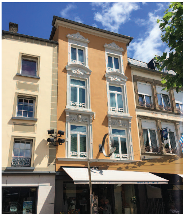
Nei Façade um Gebai vum Syndicat d'Initiative