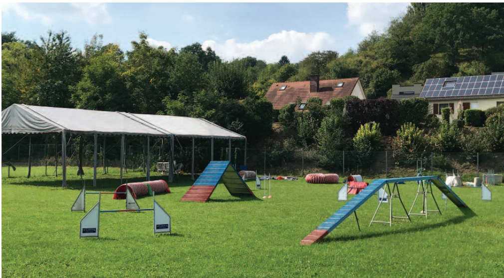
Neien Trainingsterrain fir Hënn am «Walebroch»