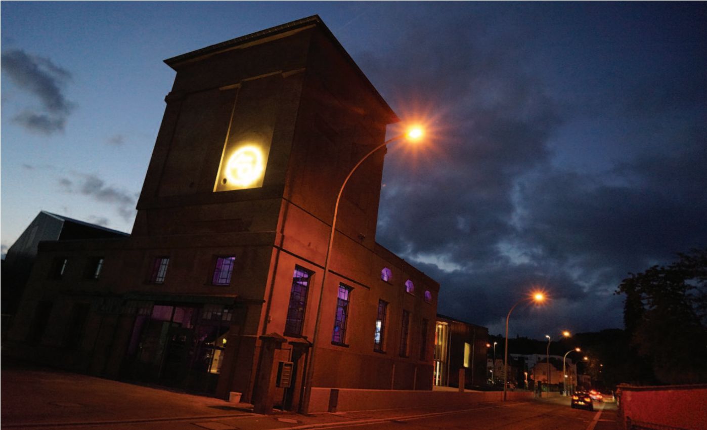
De Bistro am Tuerm vu bannen a bause gekuckt