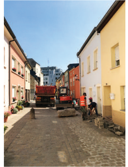
Infrastrukturaarbichten an der Rue de l'Etoile