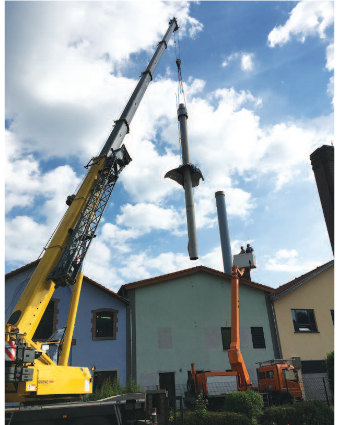
Mise en place de la nouvelle cheminée en acier de diam. ext. 800 mm et d'une hauteur de 17 m