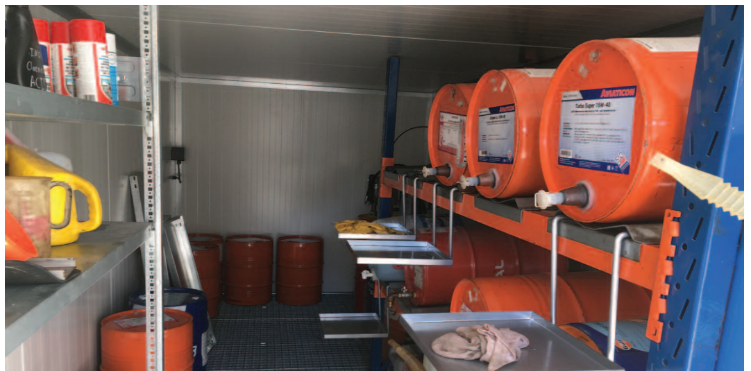
Neie Brandschutzcontainer fir de Service Technique