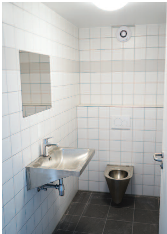
Bâtiment en façade jaune: -> Rdch: Toilettes publiques Local pour chauffage à gaz naturel 1er étage: Salle de réunion