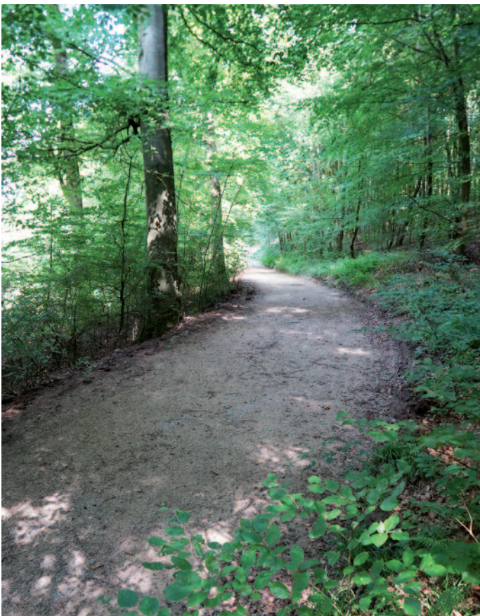
Verlängerung vum Fitness-Parcours am «Kalebësch»