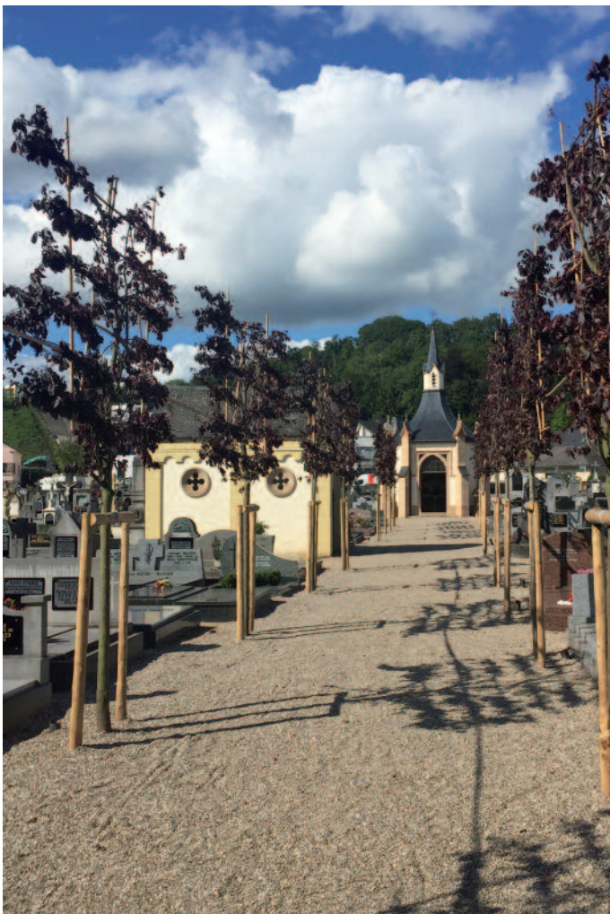
Rénovatiounsaarbichten an Uplanze vun enger neier Bamallée um Kiirfisch