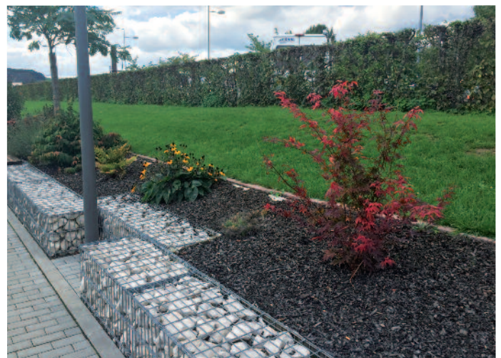
Sching ugelueschte Beeter ronderëm d'Footballsterrainen