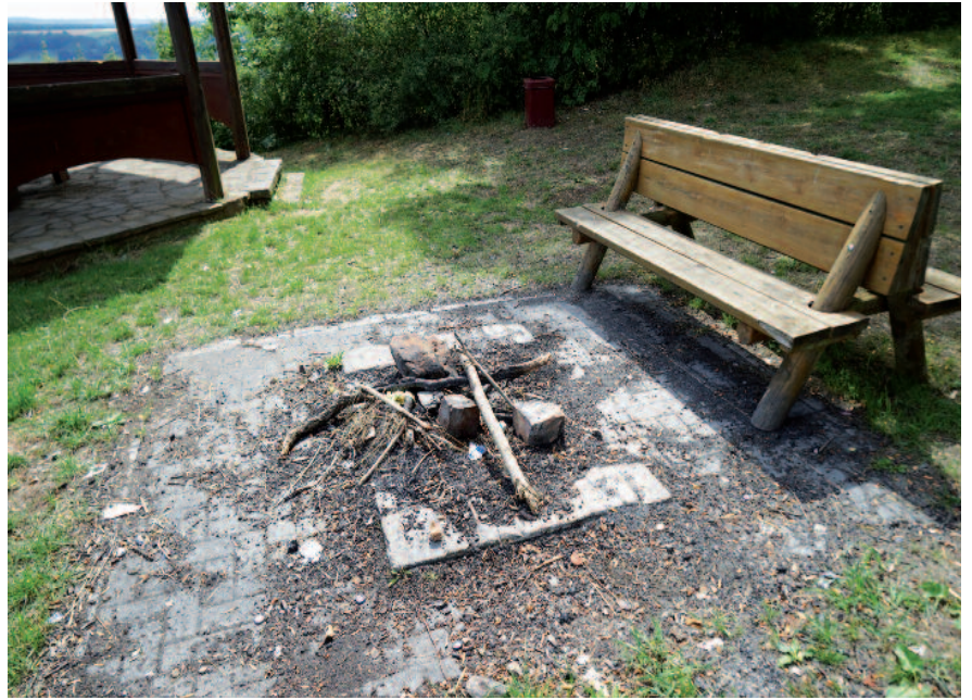
Rue du Gymnase - um Galgebierg - an der Zone Piétonne