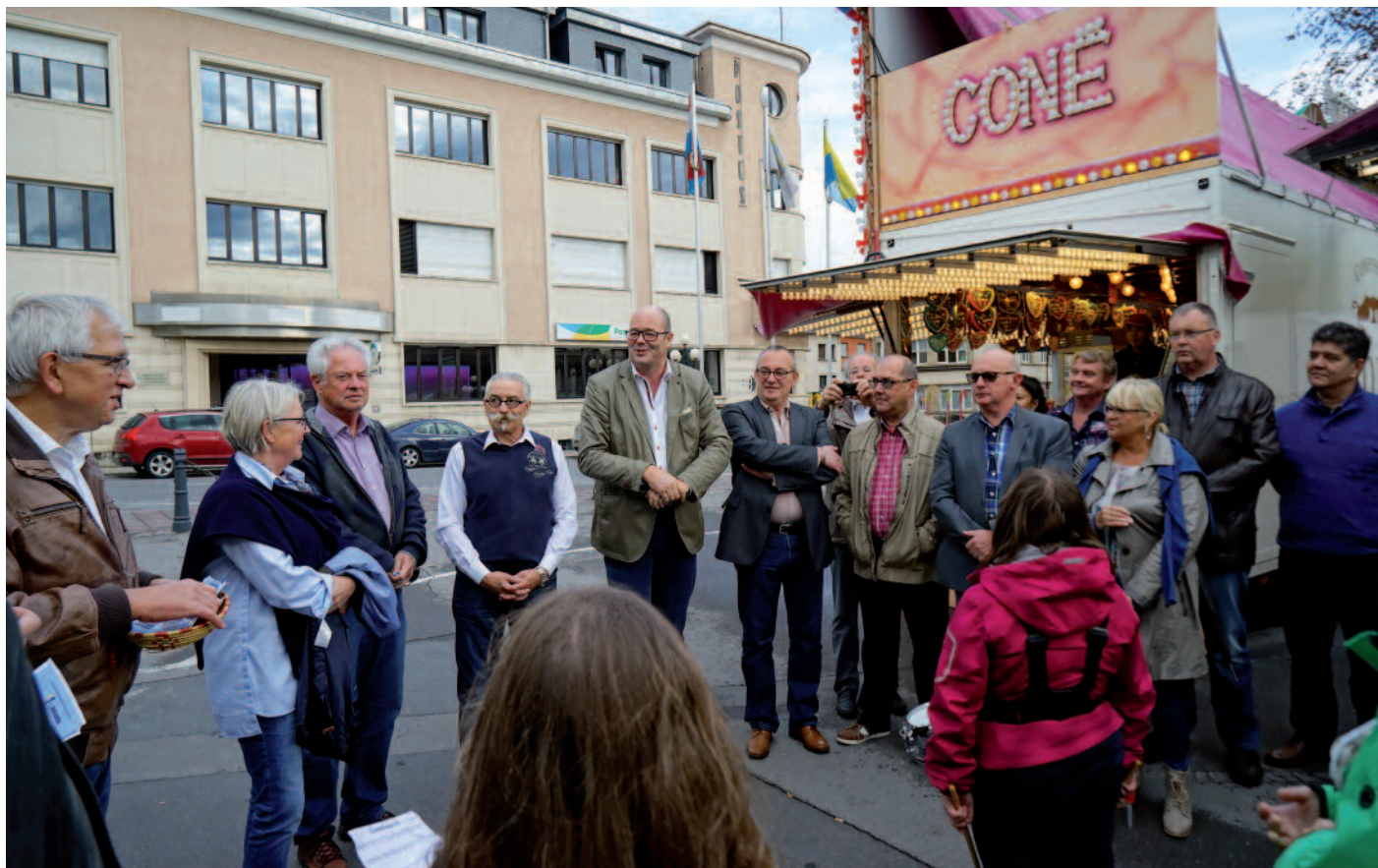
Offiziell Ouverture vun der Hierschkiermes (19.09.2015) a vum Hierschtfest (26.09.2015)