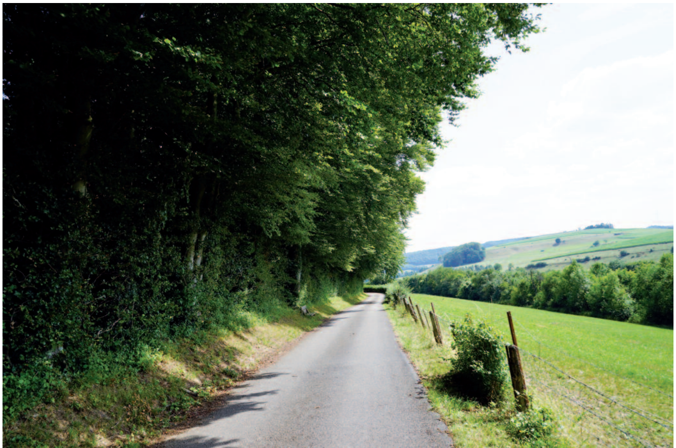
Promenade westlich laanst d'Seitert tèschent Floss a Kockelberg