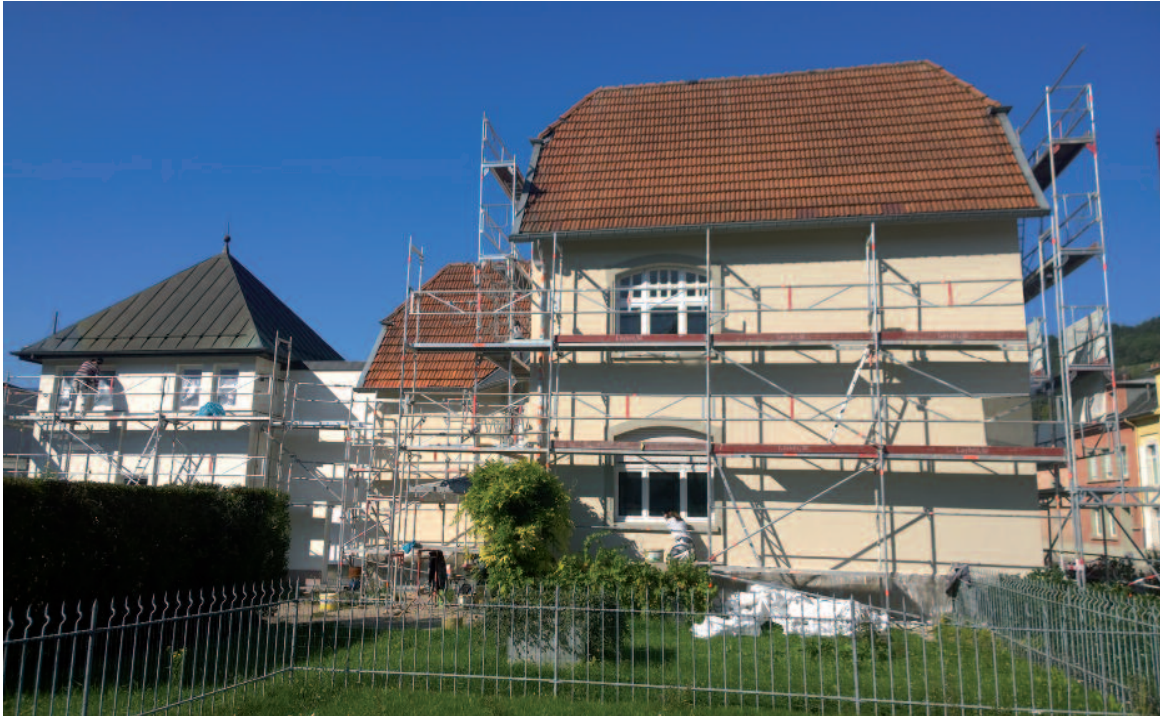
Nei Façade fir de Bureaukomplex vun de Services Industriels route de Larochette