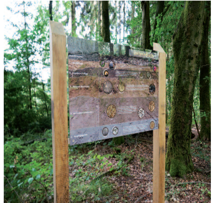
Centre écologique «Holdaer»: Installatioun vun neien Informatiounstafelen