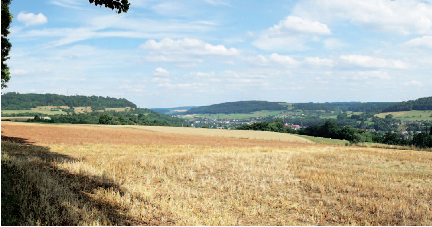
SEITERT mat Vue panoramique op den Härebiërg, de Brouderbour, d'Haardt an den Haemerich