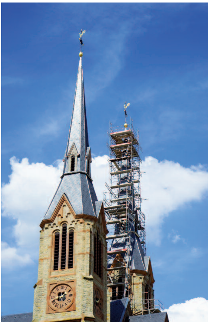
Zrücksetze vum Hunn op der Dekanatskiirch