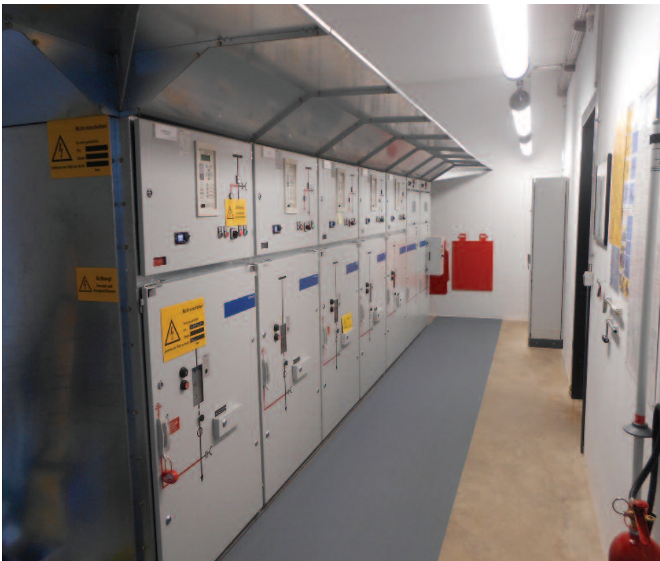
Mittelspannungsschaltanlage mit luftisolierten Leistungsschalter