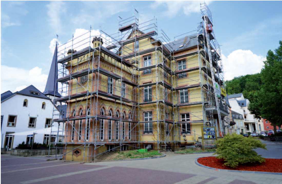
«Schlass Wirtgen»: Neien Dach an nei Façade