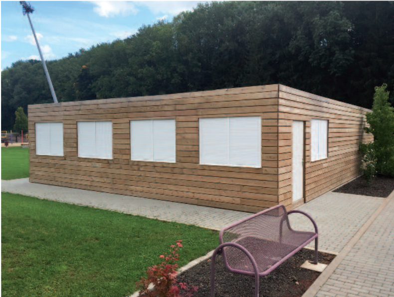
Lokal bei den Tennisterrainen