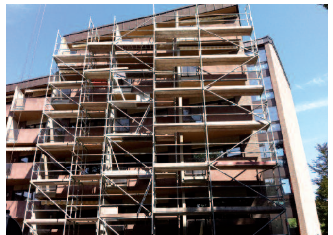
Maison de l'Orientation: Rénovatioun vun den Terrassen