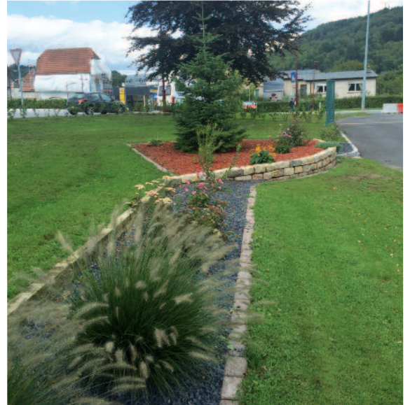
Flott ugeluechte Beeter beim Säitenagank