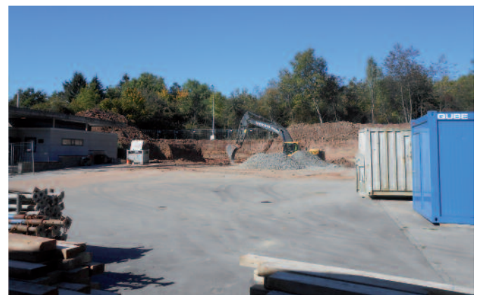
Terrassementsaarbichte fir d'Installatioun vun enger neier «Station de captage de l'antenne collective» um Häreberg