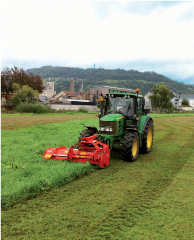
Sauerwiss: Den neie «Gemenge-Broyeur» am Asaz