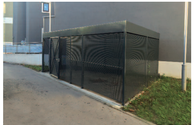
Rue du Moulin: Konstruktioon vun engem Lokal fir d'Ën- nerstelle vun Sammelkontainer (fir datt déi eenzel Dréckskëschten ronderëm déi Plaz verschwannen)