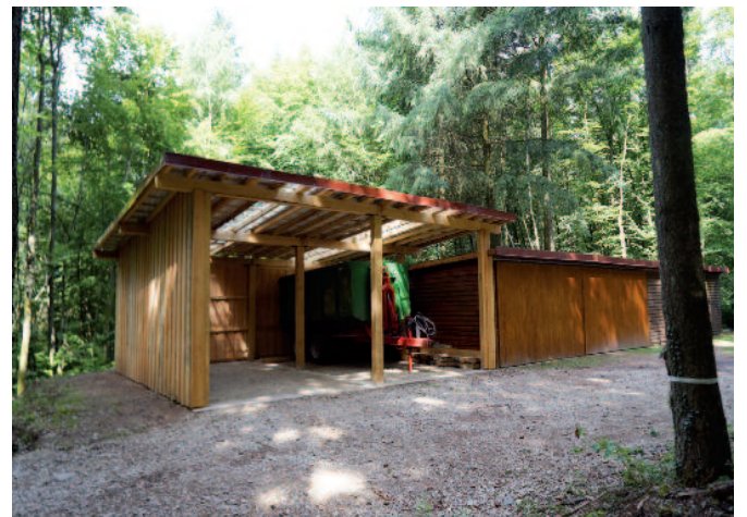
«Holdaer»: Neie Geräteschapp fir de Service Forestier