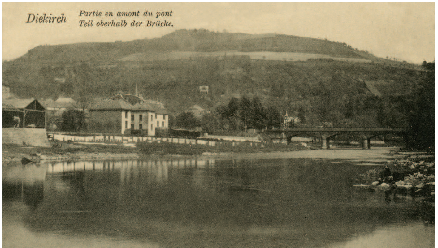
Vue op d'Stengebréck

FC Young Boys 1915/16 - Ween kann eis d'Nimm vun de Spiller matdeelen? Fir all Informatioun sich wenden un de Service des Archives vun der Gemeng (Kettesch Paul - 808780 203 oder paul.kettesch@diekirch.lu ) - Merci am viraus!