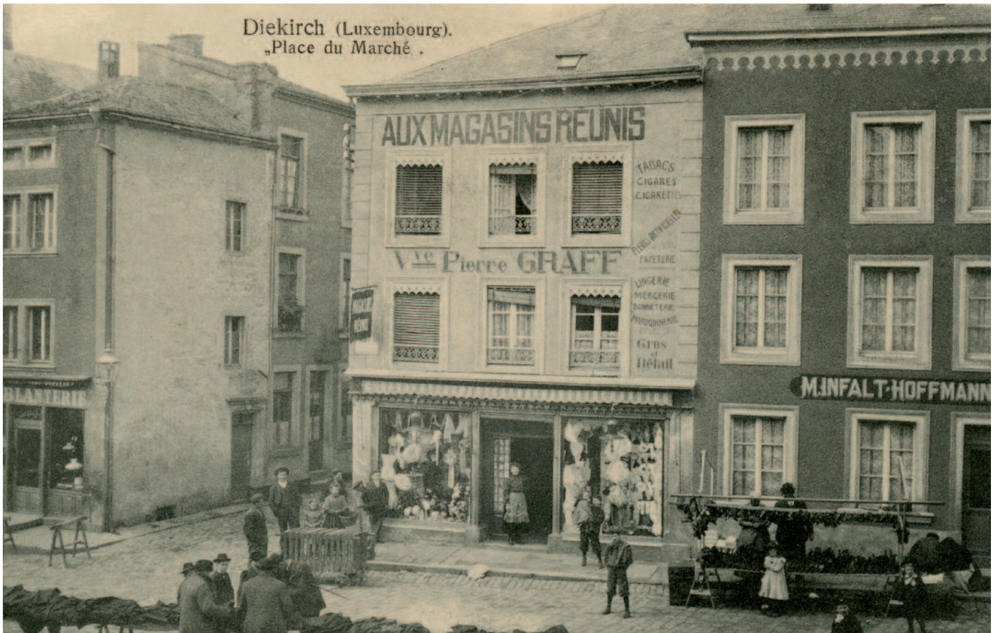
Eck Rue des Halles / Place de la Libération (Fréier Place du Marché)