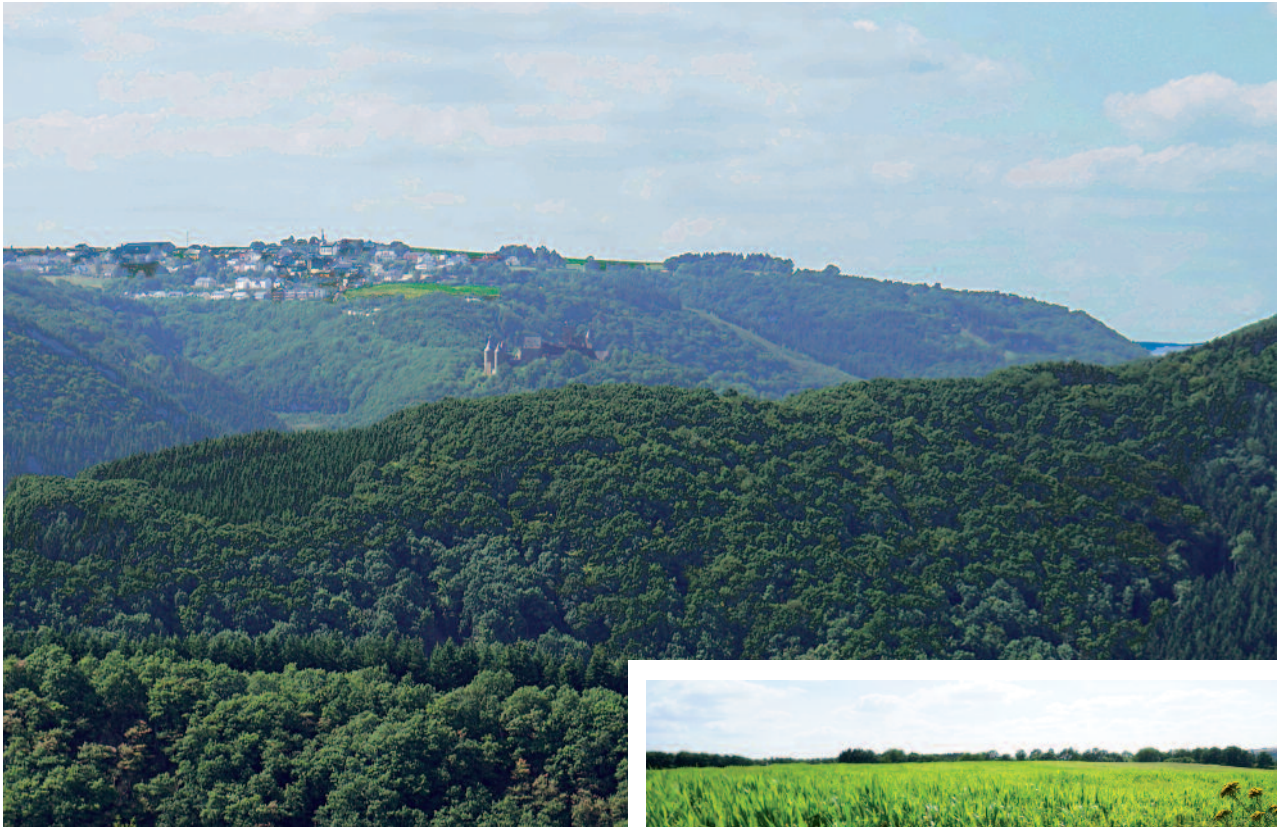
FRIDBËSCH mat ville Promenaden, mat Vue op d'Buurschter Schlass a Buurschent a mat 2 Weieren an der Mëchelsbaach