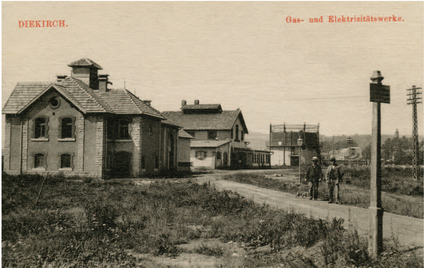
Diekircher Gas- und Elektrizitätswerke im Jahre 1918