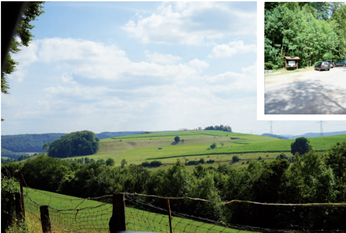
Départ op de Fitness Parcours Seitert (2760 Meter)