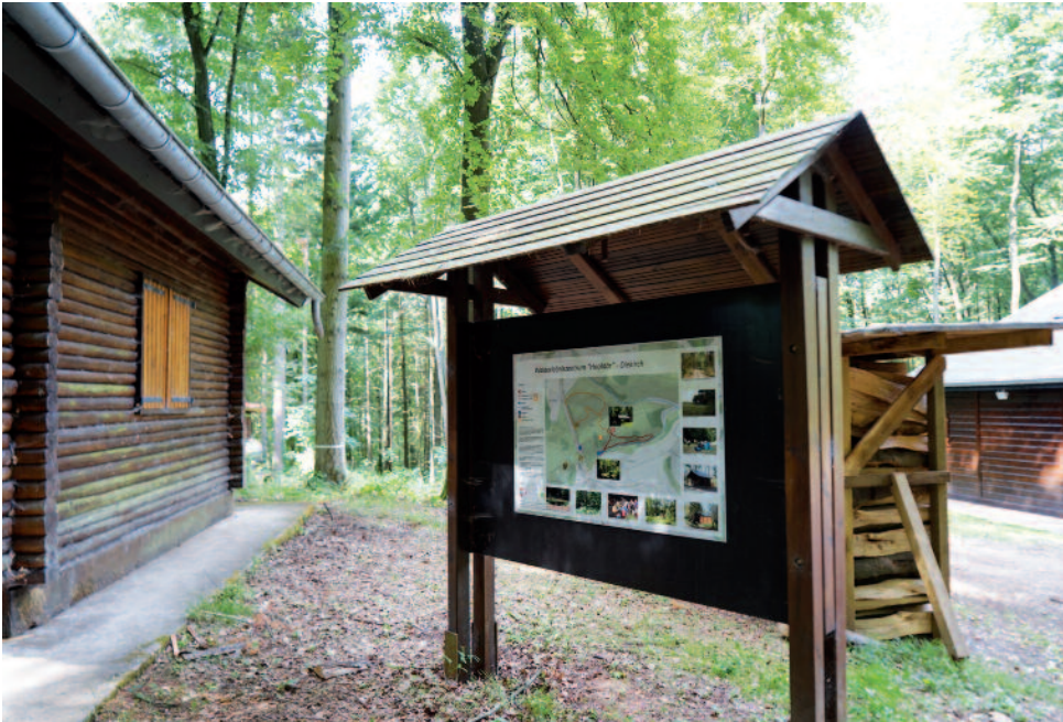
Centre Ecologique HOLDAER mat 2 neie Circuits pédestres