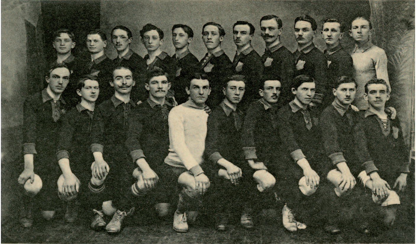
Football Club Young Boys, Diekirch 1915/16 - I. & II. Equipe