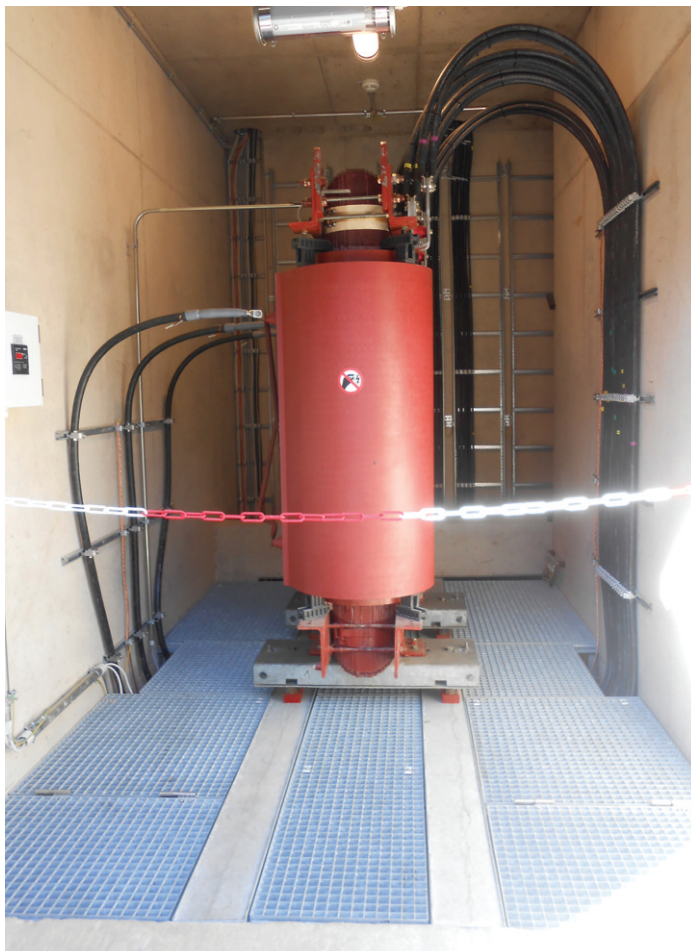
Trockentransformator 1600 kVA