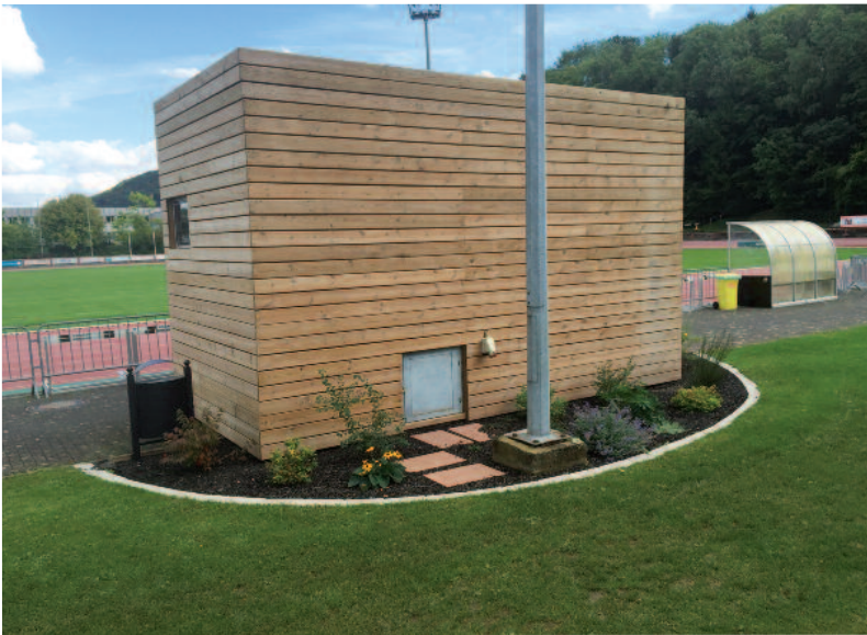
Presselokal um Stadion