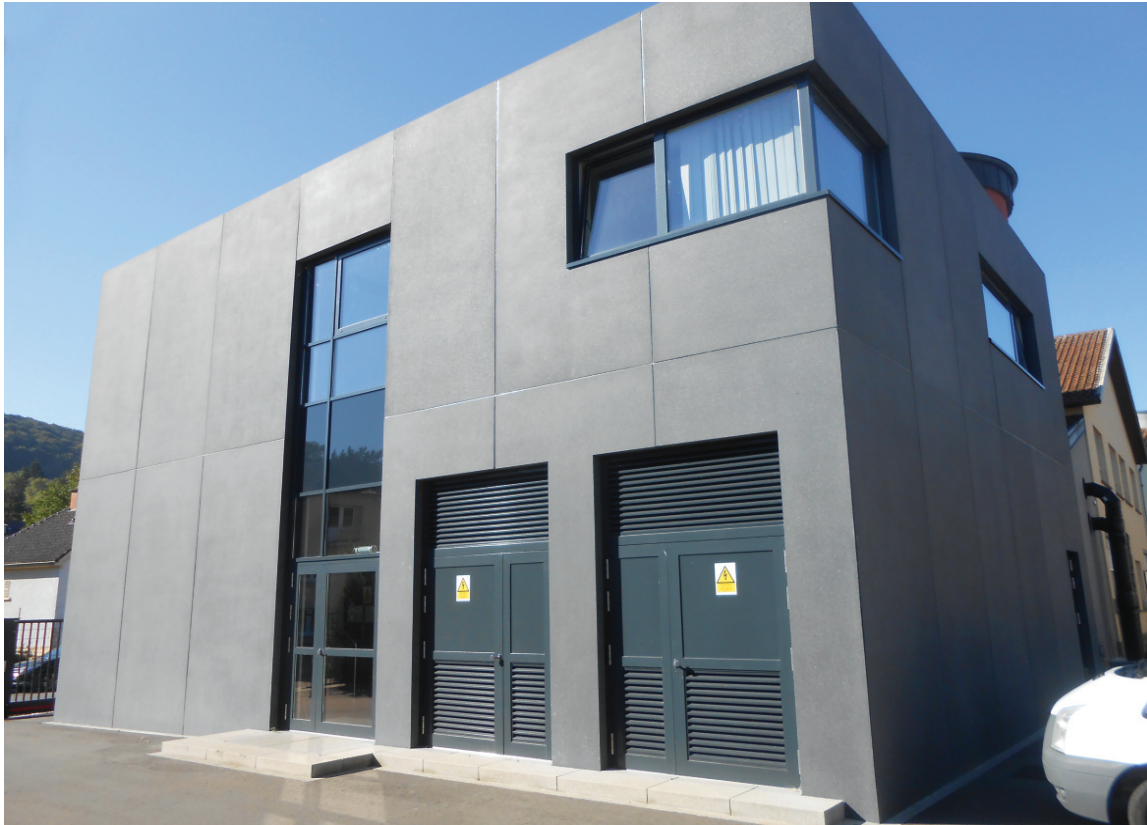
Hauptfassade des «Poste de Régie»