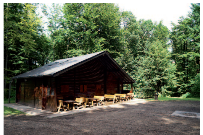
Astandsetzung vun de Chalets an der «Holdaer»