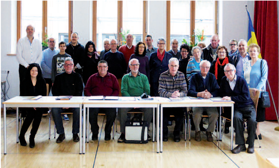
Gruppfoto Generalversammlung 2014 in der "Grondschull"