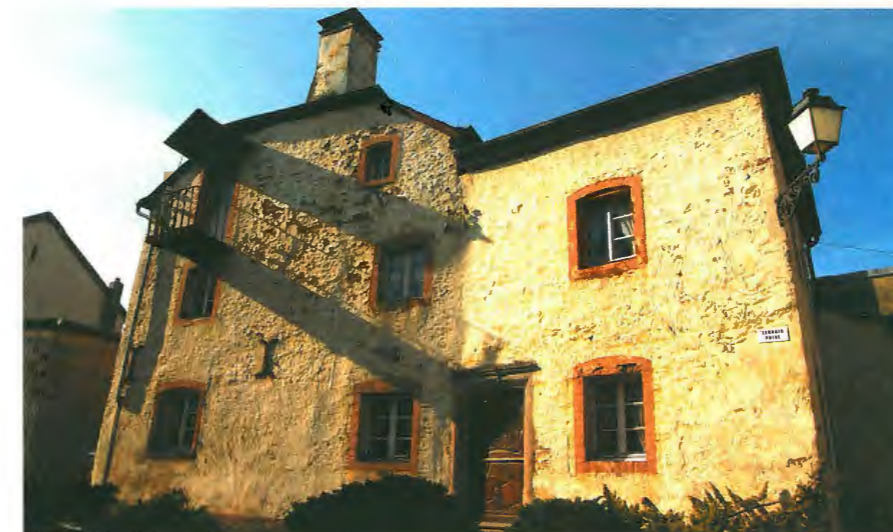
Distillerie Henry Suttor