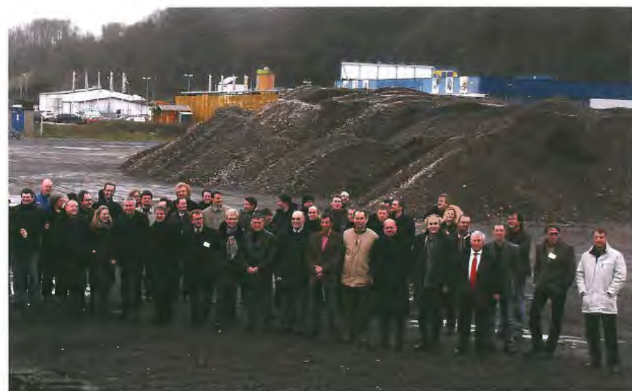
Politiker, Experten und Planer beim Start des Urbanismuswettbewerbs im Januar.

Bewusst wurden drei verschiedene Orte der Nordstad gewählt. Die Vorstellung für die Gemeinderäte wird in Diekirch stattfinden, die Pressekonferenzen in Erpeldange und die Ausstellung in Ettelbruck. Es geht darum, alle Bürger der Region am Nordstadprojekt zu interessieren, die politischen Verantwortlichen wünschen sich eine lebhaftere Diskussion.