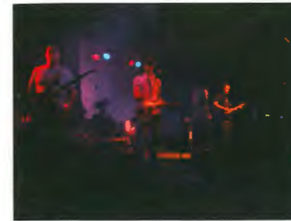
Melodie Circus / NCOS 2006

Niewt all der Livemusik gëllt et awer och nach zwou weider Attraktiounen ervirzesträichen: Engersäits ass dat d'Presentatioun vun de Schüler vum Lycée Technique Ettelbruck Annexe Diekirch. D'Schüler