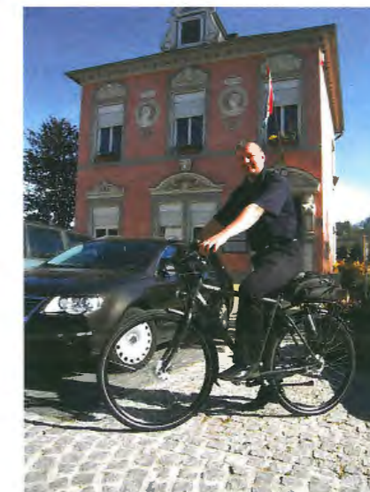
L'agent municipal sur son nouveau vélo de service pour un contrôle plus flexible de la sécurité et du stationnement.