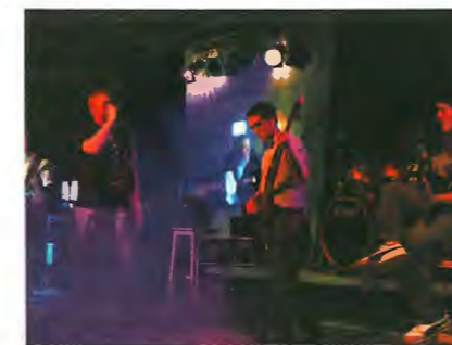
Pandora / NCOS 2006