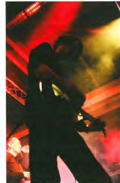
Daywalkers / NCOS 2006