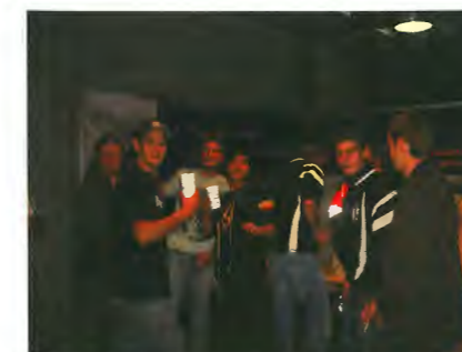
NCOS 2006 stung ganz am Zeeche vun der Sécherheet am Stroosseverkéier

hunn zesumme mat hiren Enseignanten ee Programm op d'Been gestallt deen een net verpassen dierf! Den Optrëtt besteet aus véier Elementer. Eng Schülerband, déi verschidde Coveren an awer och eege Stécker spillt; een Theatergrupp, deen ee Stéck spillt wou jidwerecht sech e bëssen dra rëmfanne kann; een Danzgrupp, dee verschidden Hip-hop-Choreographien astudéiert huet; an een Zirkusgrupp, dee vill Spektakuläres zum Thema Jongléiere verbonne mat eenzelen Zauberelementer ze weisen huet.