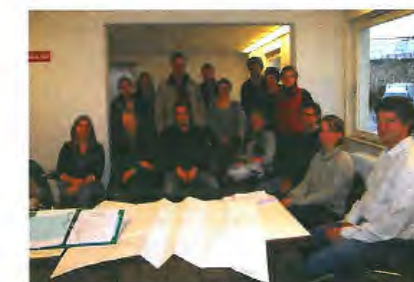
Une délégation d'enseignants, de parents, de responsables politiques et les architectes s'informent sur la réalisation d'aires de jeux auprès du service des Parcs de la Ville de Luxembourg.