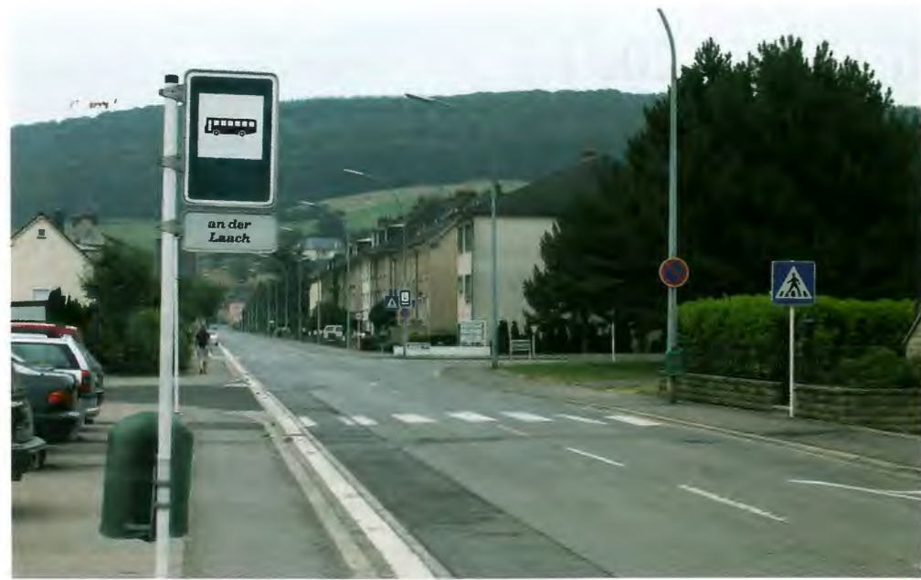
Le conseil communal a décidé un réaménagement de la «route de Gilsdorf» à Diekirch avec construction d'une gare routière dans la rue Merten et d'un parking.

1. Règlement d'urgence édicté par le Collège échevinal lors de sa séance du 02.06.2003 et portant modification temporaire à la réglementation de la circulation à l'occasion des travaux d'infrastructure dans la rue de Stavelot.