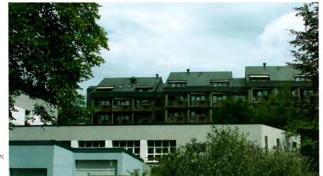
CIPA, Résidence du parc

Le Conseil communal a approuvé le règlement d'ordre interne.