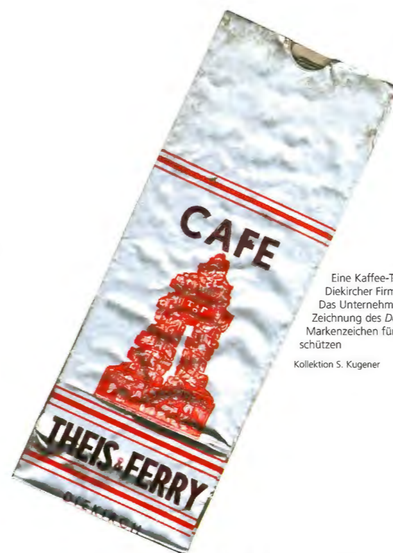
Eine Kaffee-Tüte der Diekircher Firma Theis & Ferry. Das Unternehmen liess die Zeichnung des Deiwelselters als Markenzeichen für ihre Produkte schützen