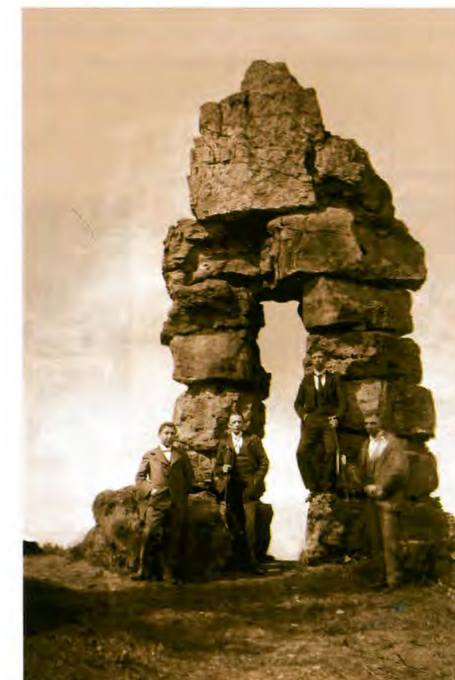
Kollektion S. Kugener

Le «Deiwelselter», dont l'état actuel est dû à une reconstruction faite en 1892, est l'un des monuments préhistoriques les plus célèbres du Grand-Duché de Luxembourg. Rares sont les témoignages sur son aspect original. Néanmoins une squelette – datant du néolithique – découvert lors de cette reconstitution permet de considérer le „Deiwelselter“ comme une sépulture mégalithique. ■