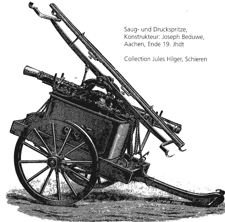
Saug- und Druckspritze, Konstrukteur: Joseph Beduwe, Aachen, Ende 19. Jhdt

10. Asche darf nicht auf dem Speicher oder in Zimmern aufbewahrt werden, es sei denn in Trögen aus Stein,