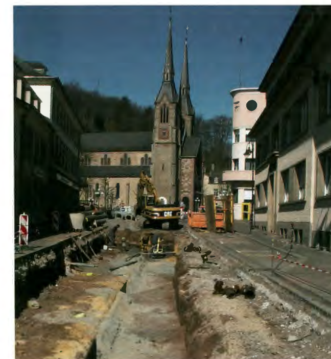
rue de Stavelot - am Gruef

a. lors de sa séance du 08.11.2002 portant modification temporaire de la réglementation de la circulation dans la rue de Stavelot à Diekirch.