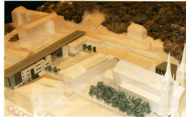
Projet du bureau d'architectes «Planet +»: 1er prix du concours complexe scolaire Diekirch

Crédit spécial supplémentaire à voter: 19.330,92 €