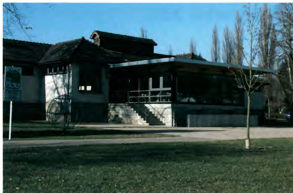
Remise en état de l'«Al Schwemm».

b. lors de sa séance du 15.11.2002 portant modification temporaire de la réglementation de la circulation dans les rue Jean l'Aveugle, rue des Ecoles, rue de l'Etoile, rue de la Brasserie, rue Guillaume, rue de l'Eau, rue du Palais, rue Goethals, rue du Tilleul, rue de Stavelot, rue Bamertal, Esplanade et rue Muller-Fromes à Diekirch.