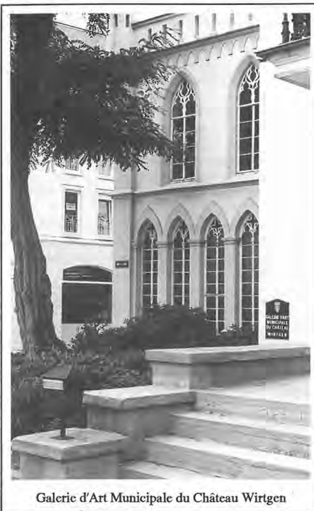
Galerie d'Art Municipale du Château Wirtgen