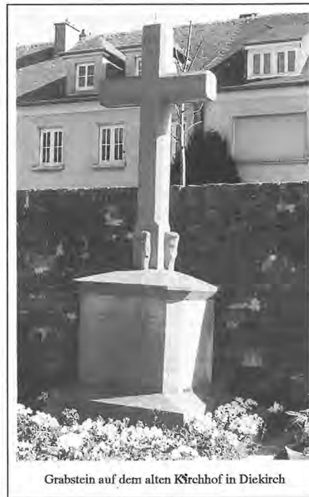
Grabstein auf dem alten Kirchhof in Diekirch

Der Klerus der Stadt Diekirch führte während drei Jahren am Ostermontag eine Rochus Dankesprozession nach Luxemburg."