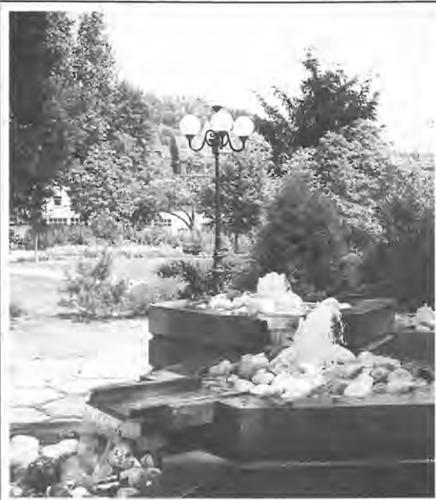
Le parc municipal