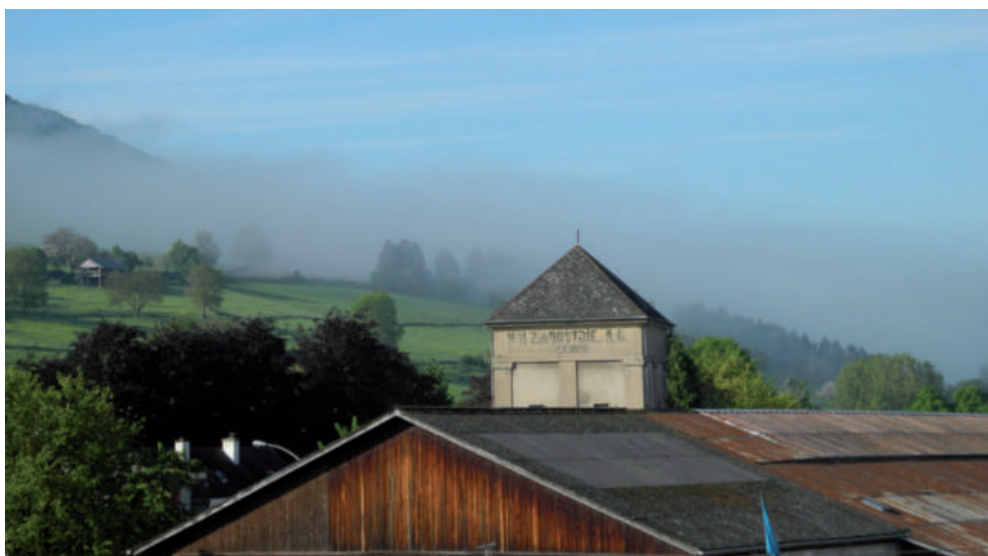
De neie Kinokomplex ass am Gebäi vun der aler Holzindustrie geplangt