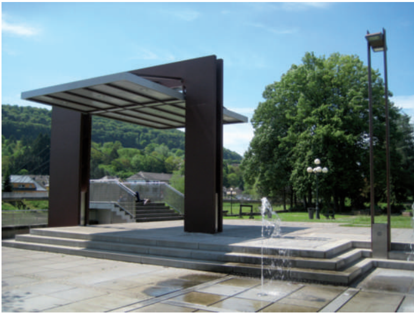
Neien Auvant am Stadpark