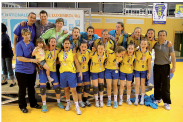
CHEV Handball Dames 1 - Finaliste Coupe de Luxembourg 2013