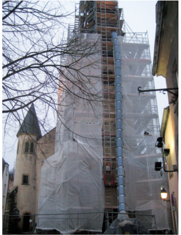
Restauratioun vun der Aler Kiirch