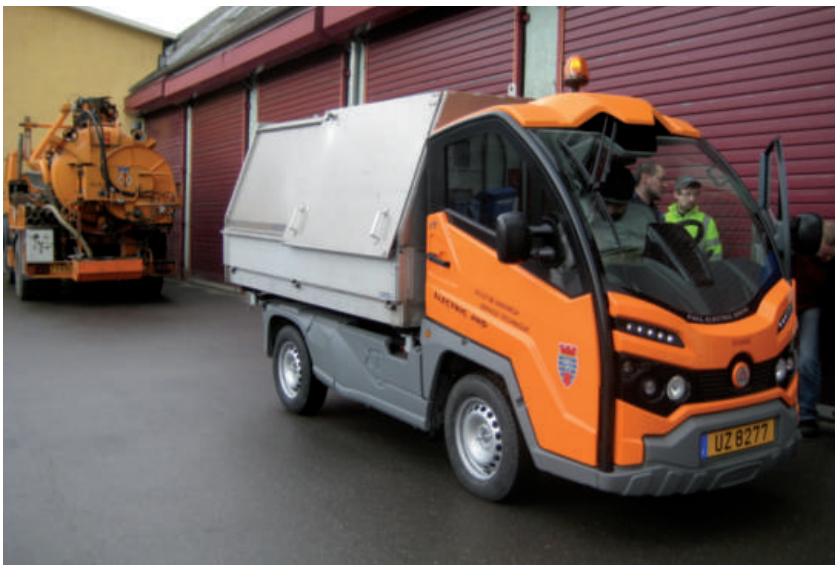
Uschafe vun engem ëmweltfrëndliche Gefier fir de Service Technique