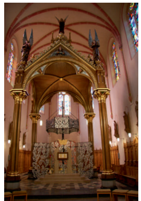
Den Interieur vun der renovierter Dekanatskiirch