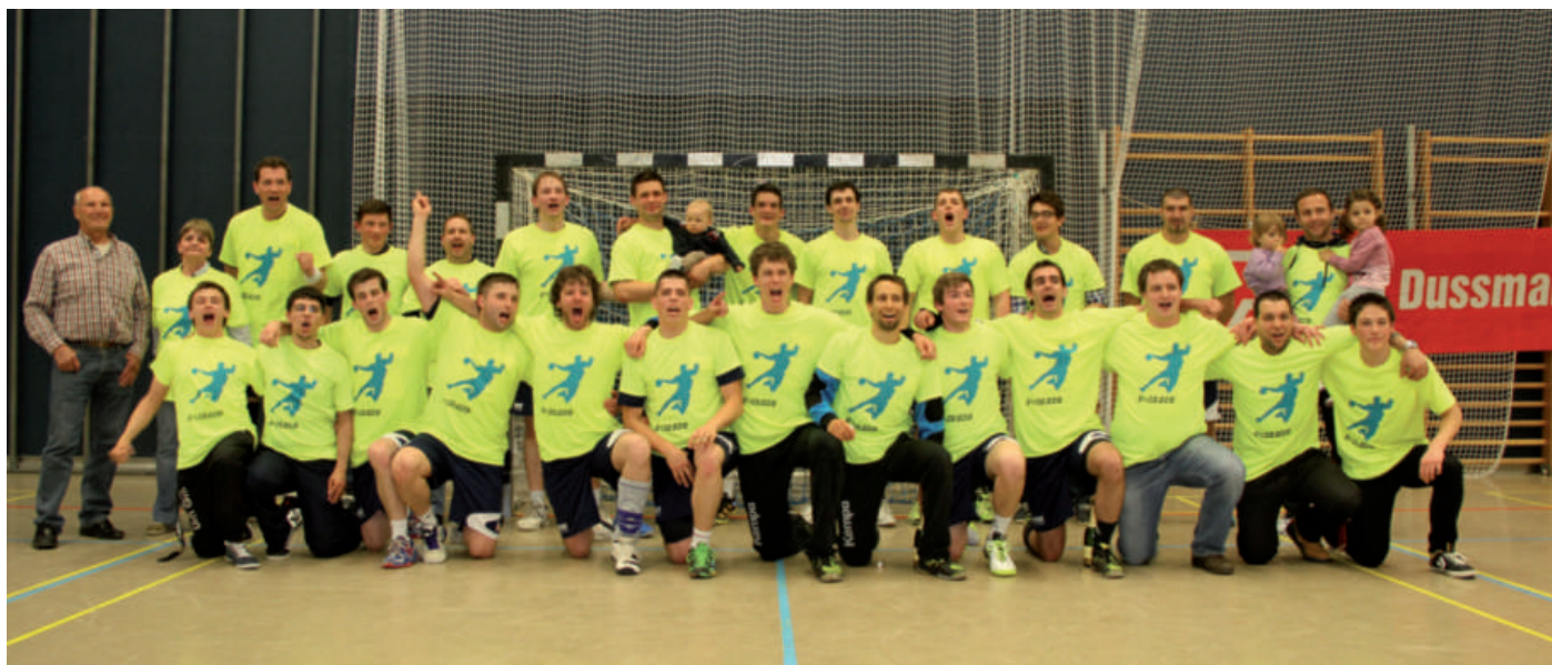
CHEV Handball Seniors 1 - Opstieg an d'Sales-Lentz Handball League 2013