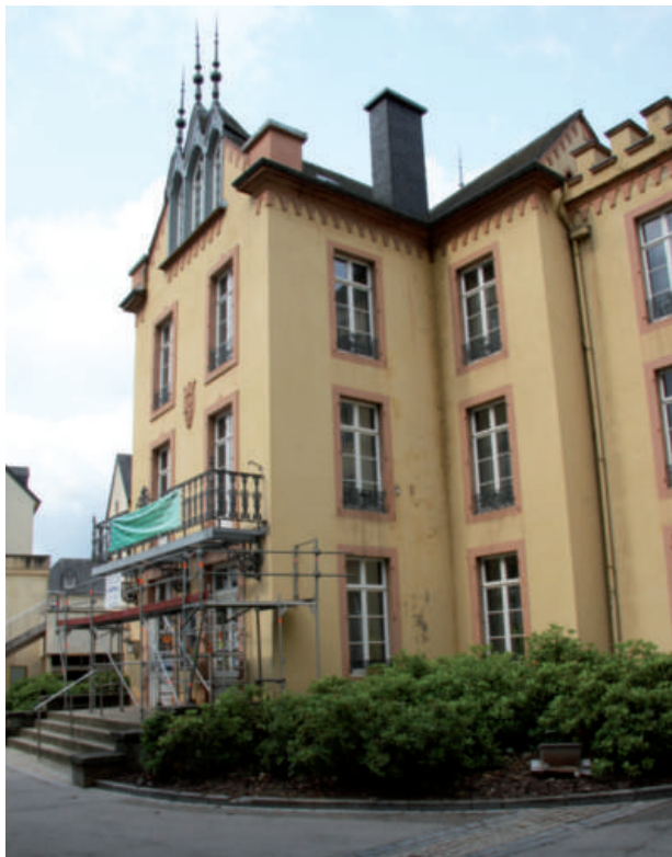
Wirtgenschlass - Balkonerneierung