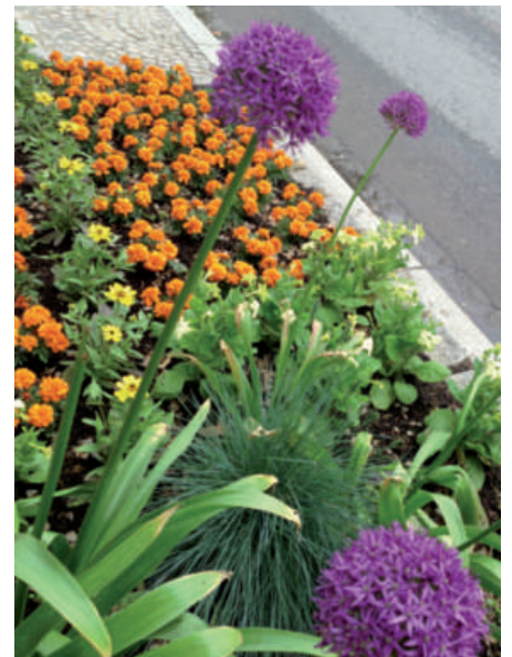
Aménagement vu Blummebeeter vum Service des Parcs - am Bamerdall - an der Avenue de la Gare