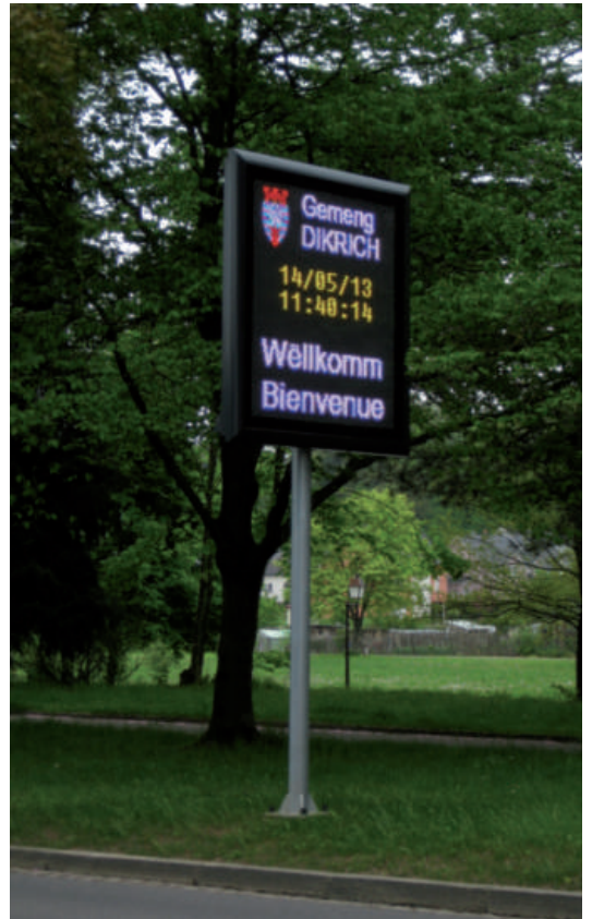
Nei Informatiounstafel am Agank vun Dikrich