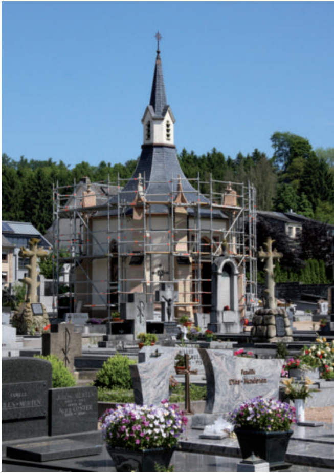
Restauratioun vun der Kapell um Kiirficht