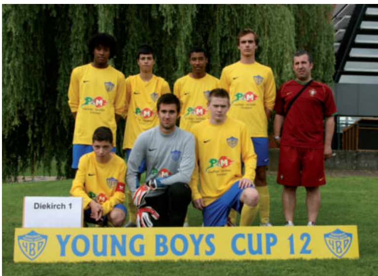
YBD - Cadets 1