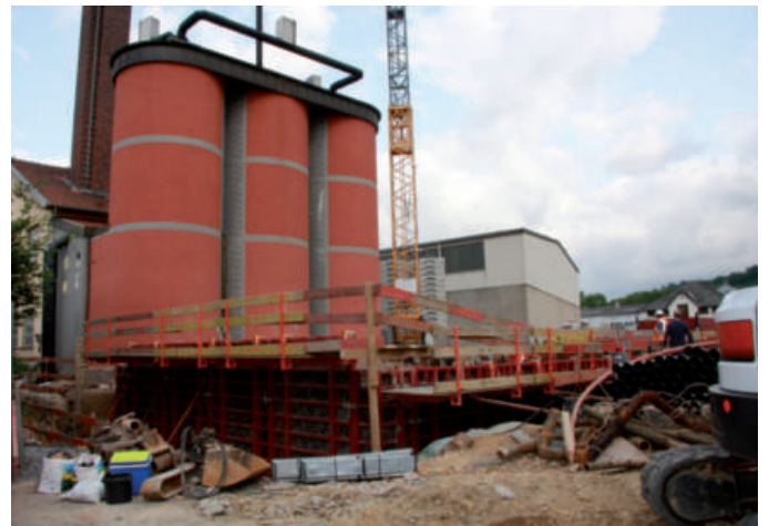
Bau vun enger elektrischer Regiezentral (Services Industriels)