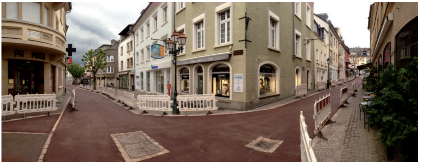
Neie Stroossebelag an der Antonius- a Brabanterstrooss