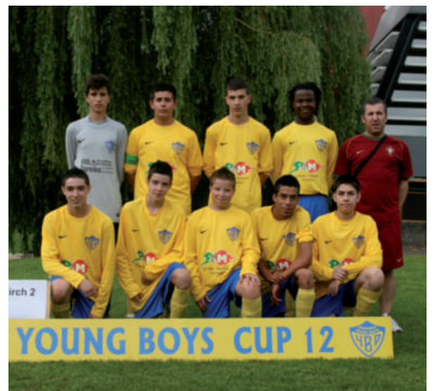
YBD - Cadets 2