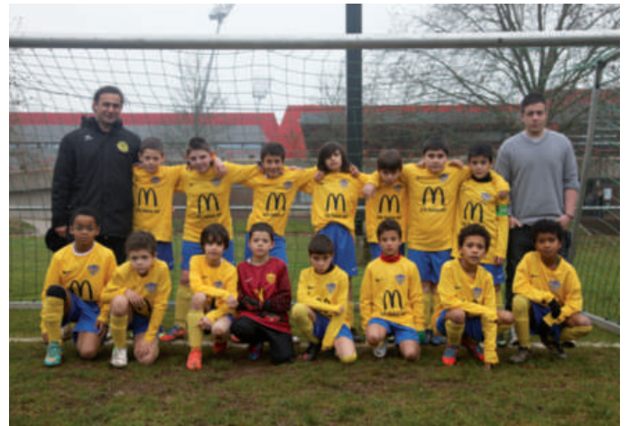
YBD - Poussins