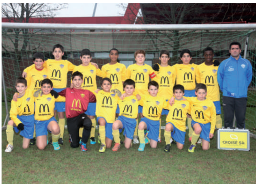
YBD - Minimes