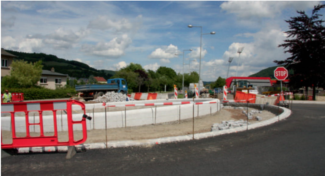
Uleë vun engem neie Rond-Point rue de Larochette/Sauerwiss/ rue Merten