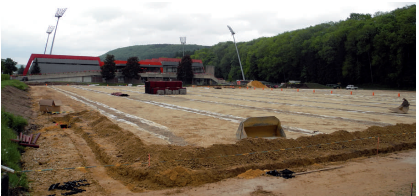
Aménagement vun synthetische Fussball- an Tennisfelder um Sportskomplex