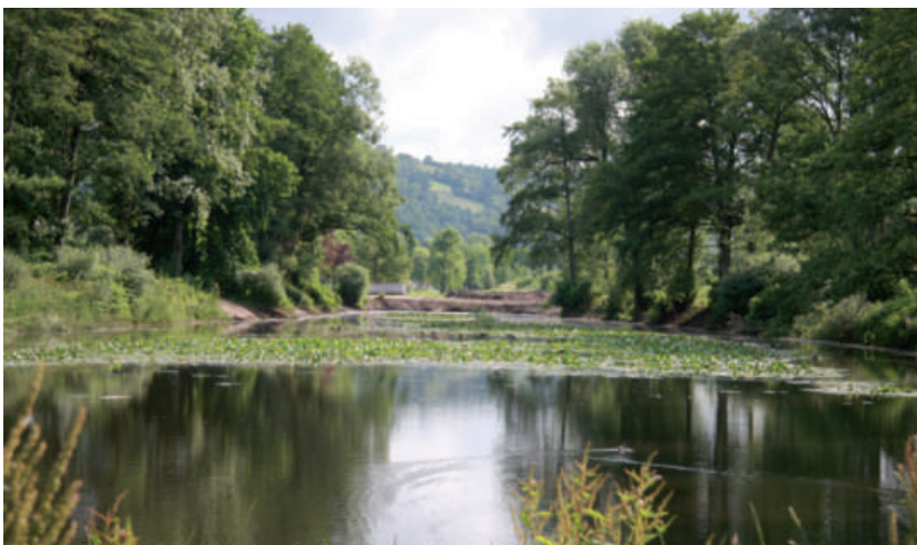
Ausbaggere vum Weier «in Bedigen» - 2. Deel