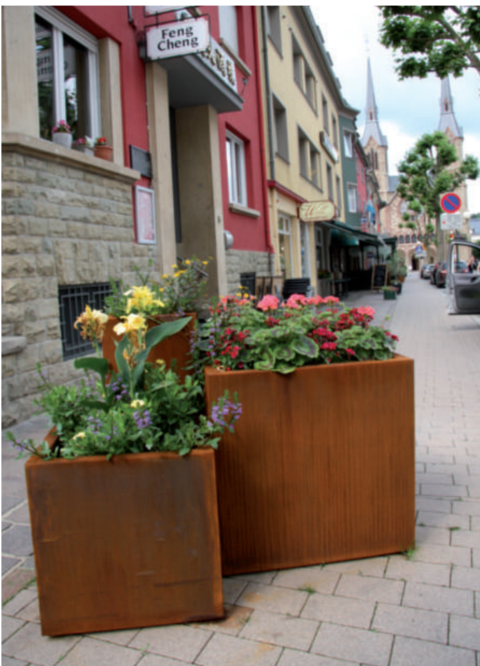
- op der Esplanade