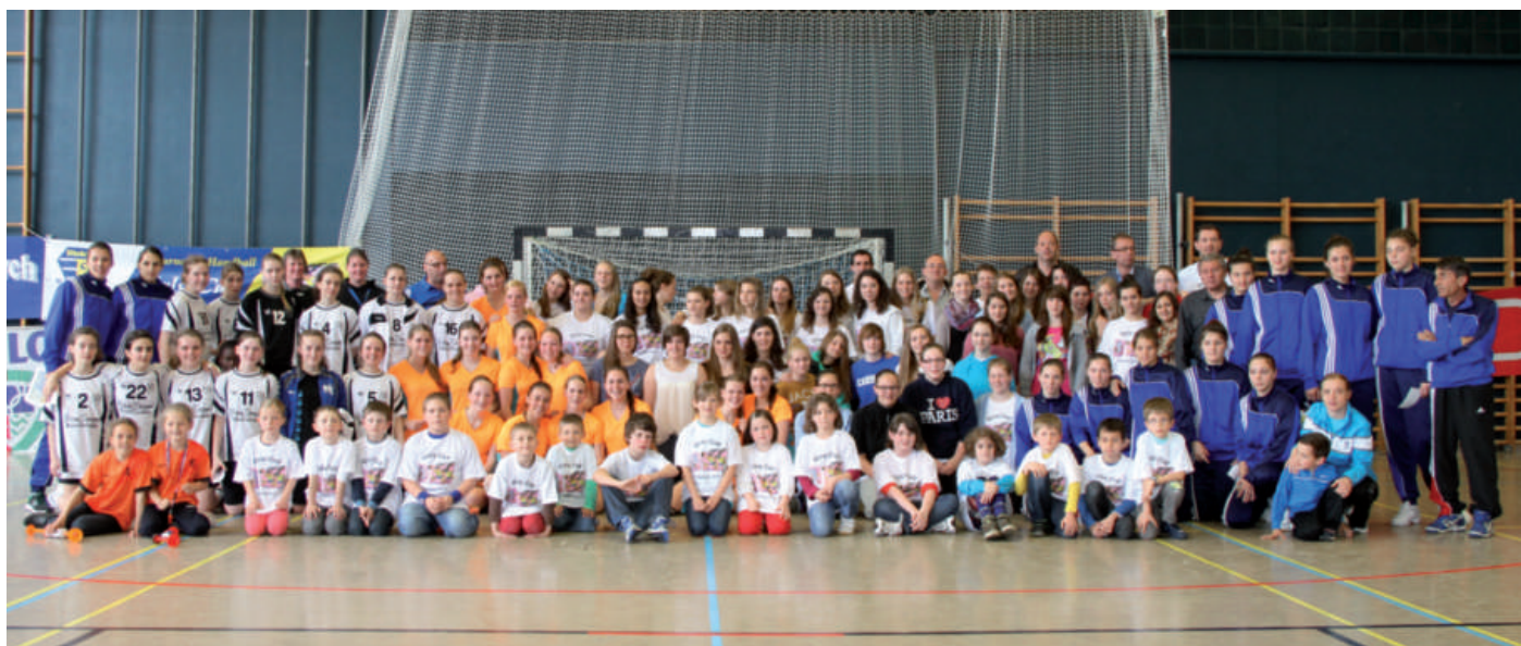
Ofschlossphoto Girl's Cup 2013