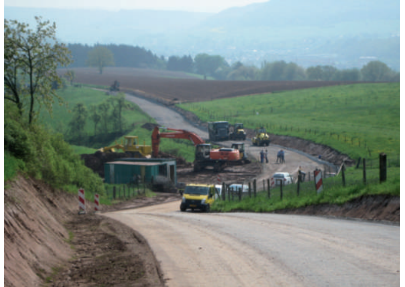
Réaménagement vun der Route d'Erpeldange op de Goldknapp