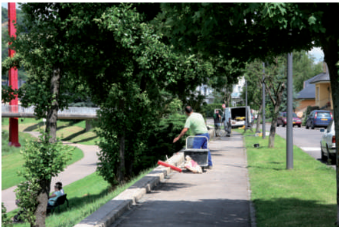
Restauratioun vun den Héichwaasserschutzmaueren an der Promenade de la Sûre an «an der Laach»