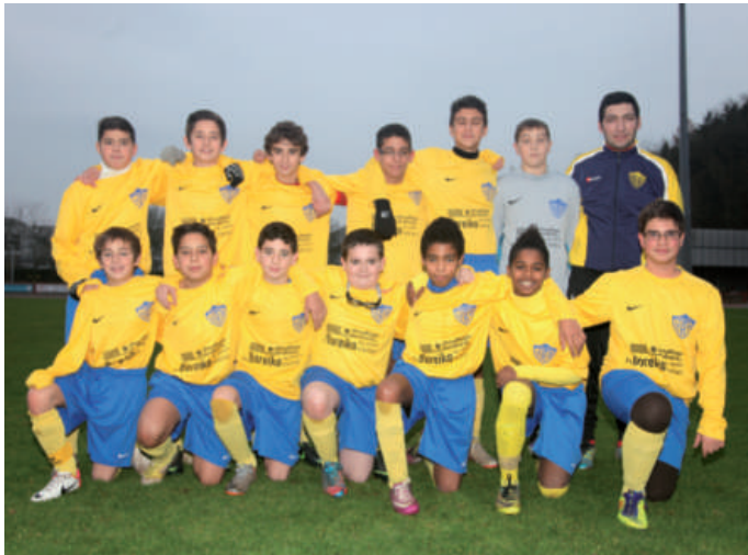
YBD - Scolaires