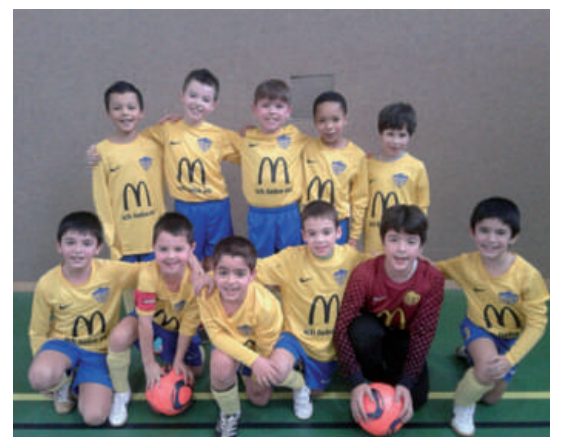
YBD - Pupilles