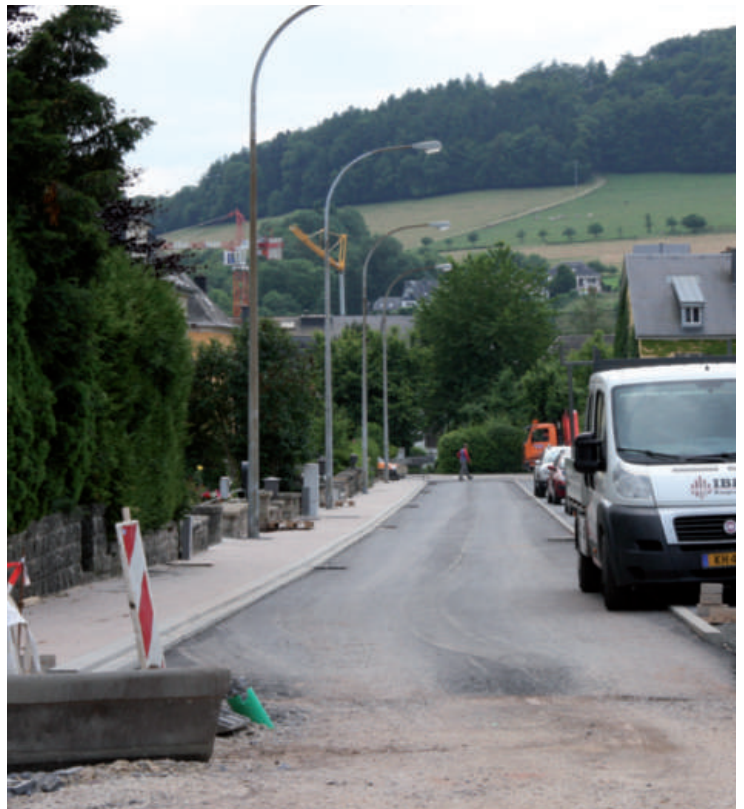
Réaménagement vun der Rue du Cimetièr