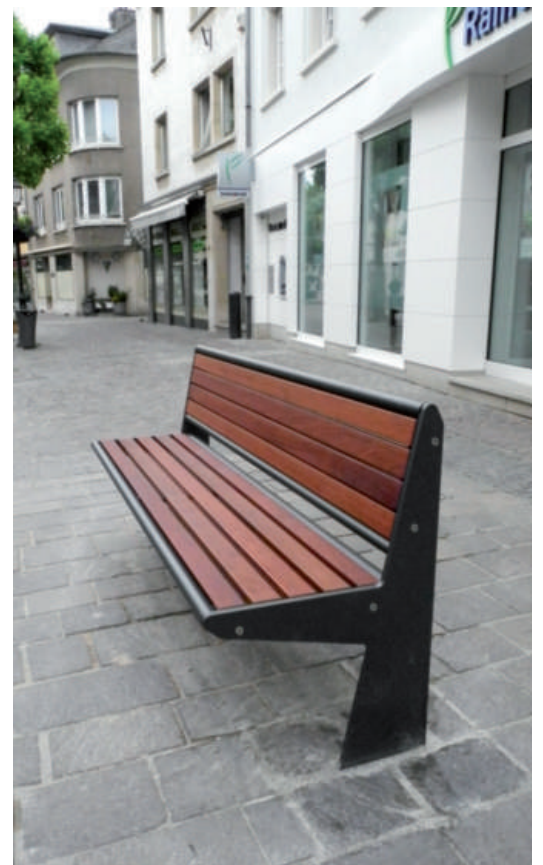
Neie Mobilier an der Foussgängerzone